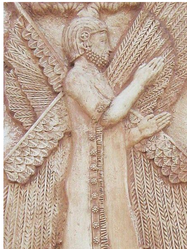
کوروش بزرگ هخامنشی

همین روز آغاز کرد. شیرویه در این روز پدرش خسرو پرویز را (در سال هشت هجری) از قدرت عزل کرد و سردار لایق ساسانی شهروراز در سال نهم هجری به دنبال صلح با روم صلیب مقدس را به اورشلیم بازآورد.