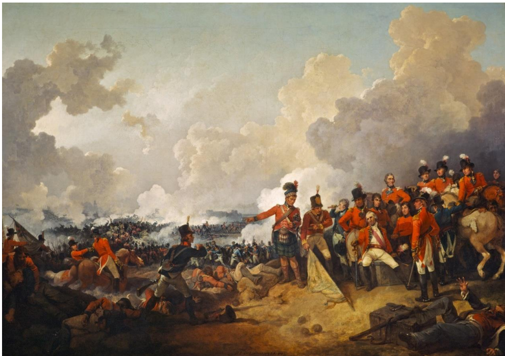
نبرد اسکندریه، نقاشی فیلیپ جیمز لوتربورگ

نوروز در ضمن سالگرد جنگهای بزرگ و خونین هم هست. در نوروز سال ۱۱۸۰ ارتش ناپلئون در اسکندریه‌ی مصر با انگلیسی‌ها جنگید، و حدود یک قرن بعد (۱۲۹۷) در همین روز آلمانی‌ها با انجام عملیات میکائیل جنگ جهانی اول را آغاز کردند. مانفرد فون ریشت‌هوفن قهرمان جنگی و خلبان برجسته‌ی آلمانی در همین روز هشتادمین هواپیمای دشمن را نابود کرد و به رکوردی جهانی در این زمینه دست یافت. در جریان جنگ جهانی دوم، انگلیسی‌ها در نوروز ۱۳۲۴ ماندالای پایتخت برمه را گرفتند و در همین روز نیروی هوایی‌شان در عملیات کارتاژ کپنهاک را چنان سهمگین بمباران کرد که تنها در یک مدرسه ۱۲۵ کودک کشته شدند. در همین روز در ۱۳۳۹ پلیس نژادپرست آفریقای جنوبی در شارپویل بر معترضان سیاهپوست آتش گشود و ۶۹ تن را کشت و ۱۸۰ تن را زخمی کرد.