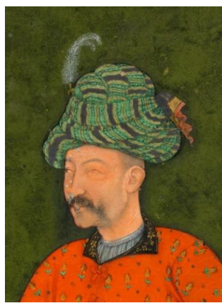
شاه عباس کبیر