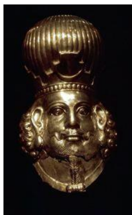
شاپور دوم ساسانی

نوروز تاجگذاری کرده‌اند. در میان شاهان دیرآیندتر نادرشاه و سلطان عبدالحمید اول عثمانی - که نوروز زادروزش (۱۱۰۴) هم بود- در رعایت مراسم نوروزی و اعلام فرمانها در این روز وسواس زیادی داشتند. عبدالحمید که شیفته‌ی شعر پارسی و شاهنامه بود، در نوروز جشنهای باشکوه برگزار می‌کرد و نادرشاه تاریخ ورودش به دهلی و نشست‌اش بر تخت طاووس (۱۱۱۸) را و همچنین ضرب سکه‌ی نادری (۱۱۱۴) را در نوروز قرار داد. قوانین مهم دیگری هم در این تاریخ وضع شده‌اند: شاه عباس در نطق نوروزی‌اش (۹۷۶) اصفهان را پایتخت ایران قرار داد، واحد پول ایران در همین روز (۱۳۱۱) از قران به ریال تغییر یافت و نام بین‌المللی کشورمان از پرشیا به ایران هم در نوروز (۱۳۱۴) اعلام شد. راه‌آهن سراسری ایران در نوروز ۱۳۱۸ راه‌اندازی شد و زمانی که محمد داود خان برنامه‌ای برای اتحاد مجدد ایران و افغانستان تدوین کرد، در نوروز ۱۳۳۹ به ایران آمد و با محمدرضا شاه در این مورد رایزنی کرد، که البته این برنامه فاش شد و بلافاصله با دخالت انگلستان ابرتر ماند.