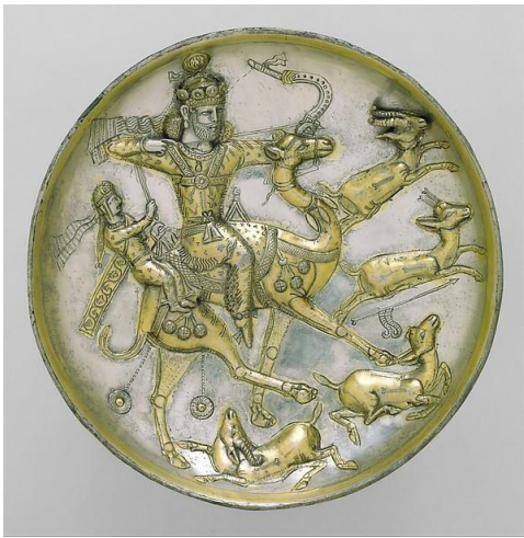
بهرام گور شاهنشاه ساسانی

از وابستگی به تمدن ایرانی که در خارج از قلمرو ایران می‌زیستند، باید از اسماعیل گاسپیرسکی (۱۲۳۰) که نظریه‌پرداز هویت مستقل تاتارها و مخالف امپریالیسم تزاری در کریمه بود. در میان وابستگی به تمدن اروپایی هم می‌توان از این افراد نام برد: از اووید شاعر رومی (۴۳ پ.م) یوهان سباستین باخ آهنگساز (۱۰۶۴) و فریدریش هولدرلین شاعر (۱۱۴۹)، و هنریک ایبسن نمایشنامه‌نویس (۱۲۰۷)، ژوزف فوریه‌ی ریاضیدان (۱۱۴۷)، مودست موسورسکی موسیقی‌دان (۱۲۱۸)، نظار قبانی شاعر (۱۳۰۲) و اسلاوی ژیزک فیلسوف (۱۳۲۸).