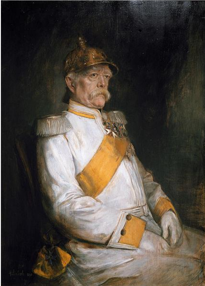
بیسمارک در هفتاد و پنج سالگی، نقاشی فرانتس فون لِنباخ

هراکلیوس در آنجا مراسمی بزرگ با بهره‌جویی از نمادهای مسیحی بر پا کرد و این را دستاوردی بزرگ برای خود دانست.