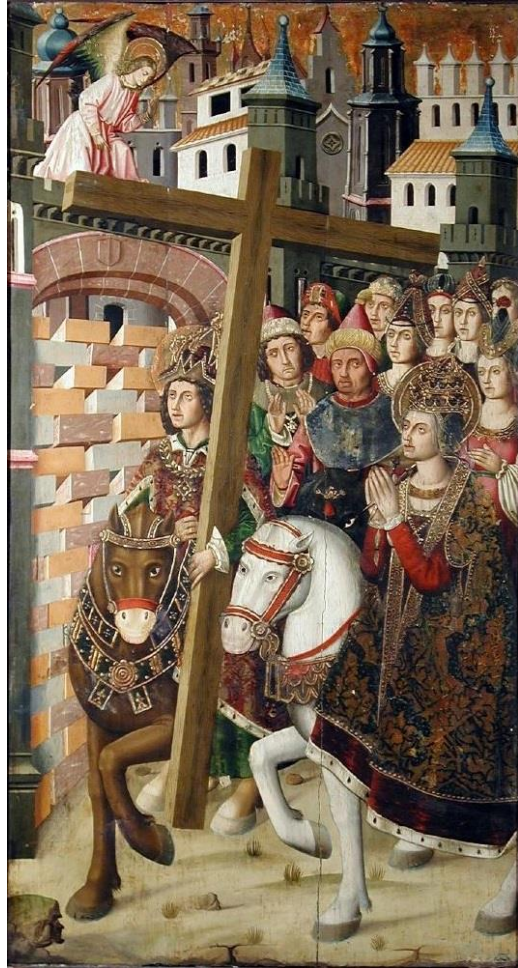
بازگرداندن صلیب مقدس به اورشلیم به دست