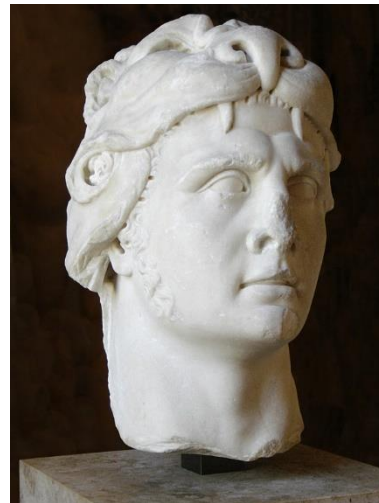
مهرداد ششم پونتی

رسم رزم‌آرایی در نوروز در سرزمینهای همسایه‌ی ایران نیز وامگیری شد. چنان که امپراتوران روم هم اغلب در این تاریخ به ایران حمله می‌آوردند. یولیانوس مرتد در نوروز ۳۶۳ م و هراکلیوس مسیحی در ۶۲۲ م و ۶۲۳ م در همین روز فرخنده سپاهیان خود را از شهرهای خویش به جانب خاور بیرون بردند.