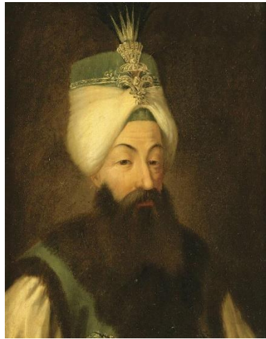
سلطان عبدالحمید اول عثمانی