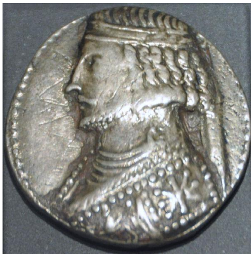
فرهاد چهارم اشکانی