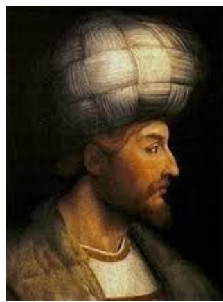
شاه اسماعیل صفوی