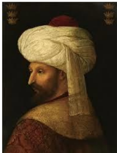
سلطان محمد دوم (فاتح)

۱۲۳۵ عهدنامه‌ی پاریس امضا شد و جنگهای کریمه خاتمه یافت. یک دهه بعد (۱۲۴۶) آمریکایی‌های آلاسکا را به قیمت ۷/۲ میلیون دلار از روسیه خریدند و حدود سی سال بعد (در ۱۲۷۸) جامعه‌ی شیمیدانان آلمان دعوتنامه‌ای برای انجمنهای علمی دنیا فرستاد تا در همایش تعیین وزن علمی عناصر شرکت کنند.