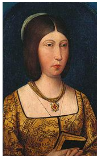
ایزابلا ملکه‌ی کاستیل

گذشته از این دو رخداد ناخوشایند که چروکیدگی سپهر نفوذ تمدن ایرانی را به دنبال داشت، در سطح جهانی با زنجیره‌ای پرتکاپوتر از رخدادها سر و کار داریم. در یازدهم فروردین سال ۳۰۷ میلادی کنستانتین رومی در همین روز زنش مینروینا را طلاق داد تا با دختر امپراتور ماکسیمیلیان ازدواج کند و به این ترتیب راه دستیابی به اورنگ سلطنت برایش هموار شود. او به این ترتیب بستری ساخت تا به نخستین امپراتور مسیحی روم تبدیل شود و به این ترتیب جبهه‌ی روم شرقی با ابزار تعصب دینی در برابر ایرانیان تقویت نماید. بیش از هزار و صد سال بعد (در ۵۲۵ خورشیدی) الگویی مشابه در مناطق غربی تر رخ نمود و آن هنگامی بود که برنارد اهل شروو