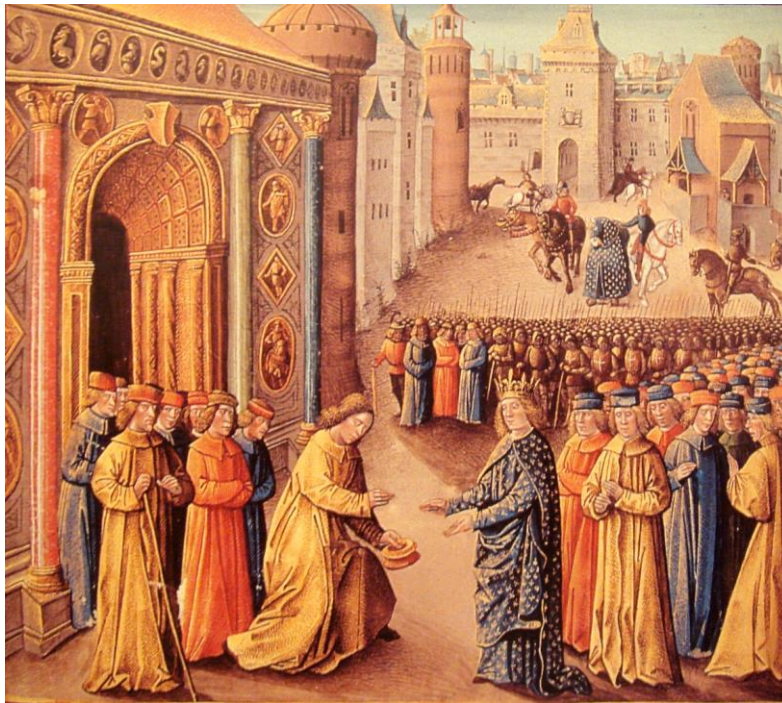
خوشامدگویی ریموند اهل پواتیه به لویی هفتم در برابر دروازه‌های انطاکیه

در وِزِلای موعظه کرد و مردم را به جنگ صلیبی و حمله به مرزهای غربی ایران زمین برانگیخت. لویی هفتم که در این مجلس حاضر بود این دعوت را لبیک گفت و رهبری جنگ صلیبی دوم را بر عهده گرفت و این جریان بود که پس از قتلها و غارت‌های فراوان در نهایت به شکست و اسارت خودش منتهی شد