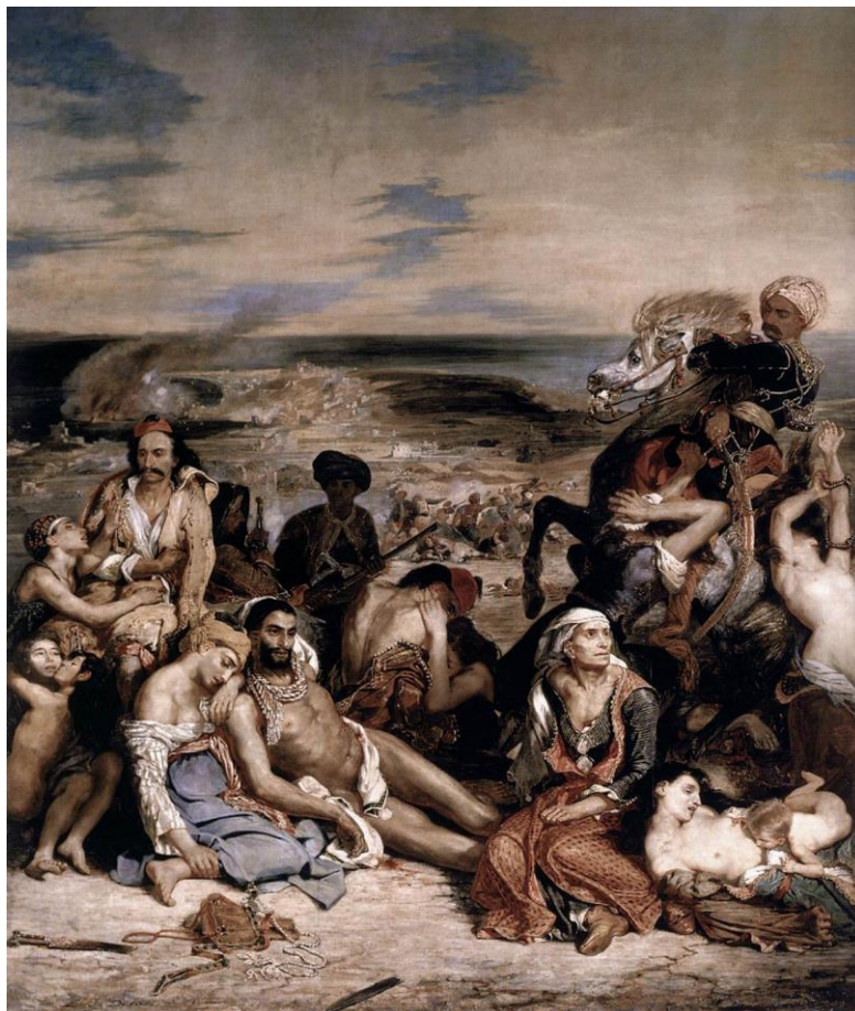
کشتار خیوس، اثر اوژن دلاکروا

شاید در ادامه‌ی همین رخدادها بتوان از واکنش بومیان در برابر مهاجمان امپراتوری هم یاد کرد. در یازدهم فروردین ۱۳۲۱ ژاپنی‌ها در جریان جنگ جهانی دوم به جزیره‌ی کریسمس که مستعمره‌ی انگلستان بود حمله بردند و غربی‌ها را راندند. در همین روز در ۱۳۳۸ دالایی‌لما به دنبال حمله‌ی چینی‌ها به کشورش از تبت گریخت و به هند پناهنده شد. در همین روز به سال ۱۳۵۸ آخرین سرباز انگلیسی جزیره‌ی مالتا را ترک کرد و این مستعمره نیز استقلال خود را باز یافت. آخرین رخداد از این رده بیست و پنج سال قبل رخ داد و آن وقتی بود که کمونیسم شوروی فرو پاشید و در همین روز در ۱۳۷۰ همه‌پرسی‌ای در گرجستان برگزار شد و ۹۹٪ مردم به جدایی از شوروی و استقلال گرجستان رای دادند، هرچند شرایط ایران جنگ‌زده‌ی درگیر ایدئولوژی‌های مذهبی به شکلی نبود که این استان کهنسال مسیحی به دامان ایران زمین بازگردد و از آن هنگام به صورت کشوری کوچک با سیاستی آشفته درآمد.