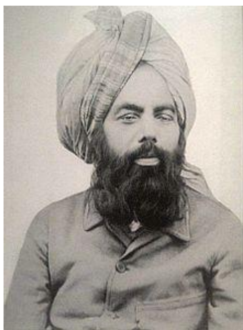
میرزا غلام احمد

سوم فروردین روز جهانی آب و هواشناسی است و روز ملی پاکستان است. مصریان هم با گرفتن جشن شمن‌النسیم فصل بهار خود را با آن آغاز می‌کنند. از نظر تاریخی سومین روز از ماه فروردین سالگرد تاسیس نهادهای سیاسی‌ایست که در شرایطی بحث برانگیز شکل گرفته‌اند و به نسبت بدنام هستند. در سوم فروردین ۱۲۶۸ جماعت احمدیه در قادیان هند به دست میرزا غلام احمد تاسیس شد. میرزا غلام احمد مدعی بود که تناسخ مسیح و مهدی موعود است و بر این مبنا فرقه‌ای ایجاد کرد که امروز نزدیک ده میلیون نفر پیرو دارد. این فرقه از سوی بقیه‌ی مسلمانان مرتد و بی‌دین شمرده می‌شوند. در همین روز به سال ۱۲۹۸ موسولینی در میلان تاسیس حزب فاشیست ایتالیا را اعلام کرد و چهارده سال بعد (در ۱۳۱۲) رایشتاگ آلمان در همین روز اختیارات تام را برای هیتلر تصویب کرد و او را پیشوای آلمان دانست.