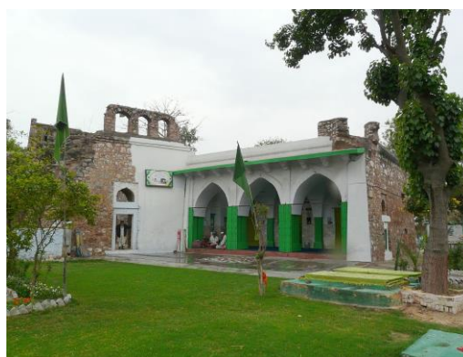
خانه (راست) و آرامگاه (چپ) نظام‌الدین اولیاء

چهاردهم فروردین در ضمن سالگرد چند رخداد جالب اما بی‌ربط هم هست. در سال ۶۵ هجری خورشیدی یوکنون بیچاک شاه کالاک‌مول در آمریکا موفق شد مایاها را متحد کند و نخستین دولت متحد مایا را پدید آورد. استالین در همین روز (۱۳۰۱) به مقام منشی کل حزب کمونیست رسید و پایه‌های قدرتش را در حزب استوار ساخت و هشت سال بعد (۱۳۰۹) هایلده سلاسی امپراتور حبشه شد. هری ترومن هم در ۱۳۲۷ طرح