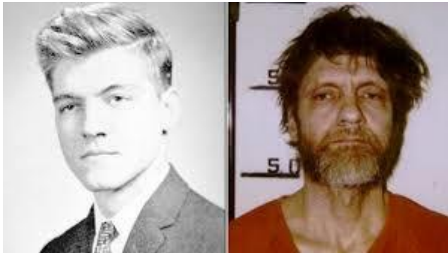
تئودور کازینسکی در جوانی و هنگام تحصیل فیزیک و در میانسالی و پس از زندانی شدن

از دوران رضا شاه به بعد اولین نشستهای مجلس شورای ملی ایران در این روز پس از تعطیلات نوروزی گشایش می‌یافت و از این رو نتیجه‌ی رایزنی‌های دولتمردان طی دید و بازدیدهای نوروزی باعث می‌شد در این روز شمار زیادی از قوانین و تصمیمهای مهم در مجلس به تصویب برسد. انتخاب رئیس و نایب مجلس و تعیین سفیر برای کشورهای دیگر از جمله تصمیم‌هایی است که اغلب در چهاردهم فروردین در مجلس به تصویب می‌رسیده است.