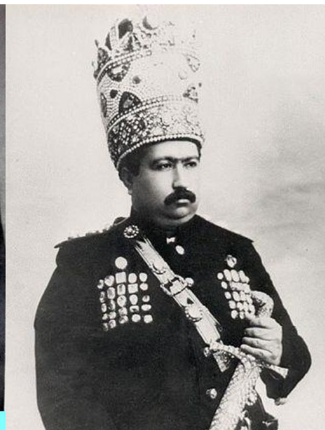
محمد علی شاه قاجار