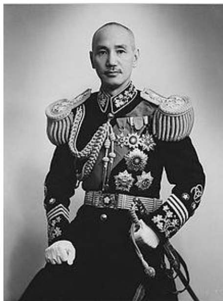
چانگ کای شک

چند کوشش حقوقی بحث‌برانگیز هم در این روز انجام شده است. در شانزدهم فروردین ۱۳۰۱ لیگ آمریکایی کنترل تولد تاسیس شد، و این نهاد نخستین قوانین زادآوری و پرورش برنامه‌ریزی شده‌ی کودکان را بر اساس اصول بهنژادی در آمریکا وضع کرد. درست ده سال بعد (۱۳۱۱) فنلاندی‌ها پس از دورانی طولانی بالاخره قانون منع مصرف مشروبات الکلی را لغو کردند. در همین روز (در ۱۳۲۴) یوسیپ تیتو کشورش یوگسلاوی را به شوروی منضم کرد و قبول کرد که ارتش سرخ در سرزمینش حضور داشته باشد. آمریکایی‌ها هم در همین روز در ۱۳۴۸ تظاهراتی باشکوه بر ضد جنگ ویتنام ترتیب دادند.