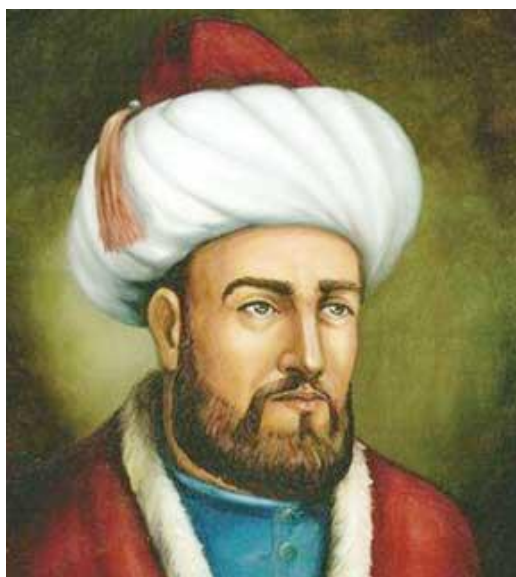
خواجه نظام‌الملک (راست)