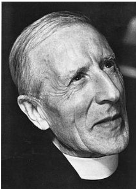
تیار دو شاردن

زادگان انیرانی بیست و یکم فروردین عبارتند از کوزیمو دِ مدیچی سیاستمدار ایتالیایی (۷۶۸)، هوگو گروتیوس حقوقدان و فیلسوف (۹۶۲)، ژوزف پولیتزر ادیب (۱۲۲۶)، عمر شریف هنرپیشه‌ی مصری (۱۳۱۱)، و استیون سیگال هنرپیشه‌ی آمریکایی (۱۳۳۱). در مقابل در این روز ژوزف لویی لاگرانژ ریاضیدان و منجم (۱۱۹۲)، اگوست لومیر بنیانگذار فناوری سینما (۱۳۳۳)، و تیار دو شاردن فیلسوف (۱۳۳۴) درگذشتند.