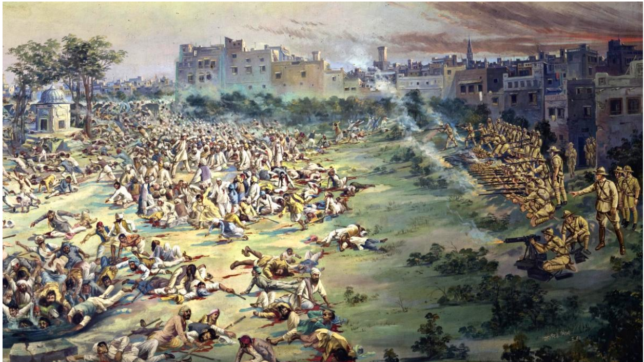
کشتار مردم پنجاب در جالیان والا باغ به دست انگلیسی‌ها

بلشویکها تقصیر خود را در این مورد انکار کردند و پیشاپیش اسنادی جعلی در جیب قربانیان گذاشته بودند که گناه را متوجه آلمان نازی کند و تا چند سال پس از پایان جنگ جهانی دوم روایت رسمی از ماجرا همچنين بود.