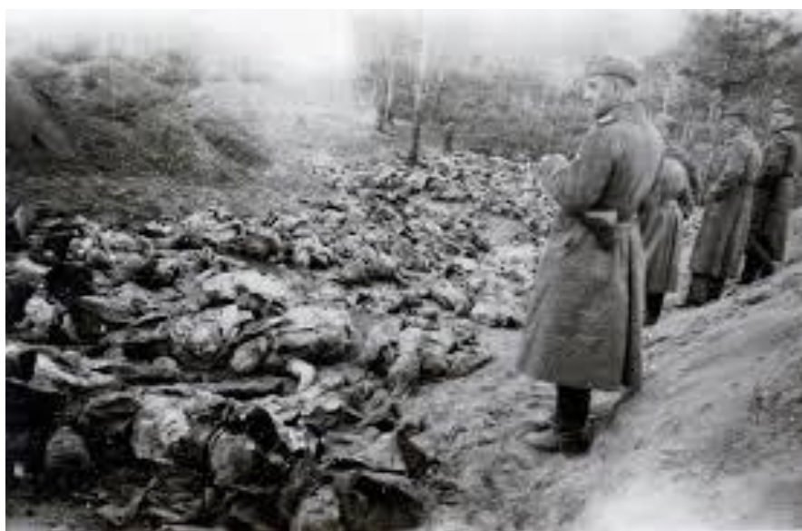
بیکر افسران لهستانی کشته شده در جنگل کاتین

رخدادهای دیگر این روز هم ارتباطی با دین برقرار می‌کنند. در ۱۰۷۸ گورو گوبیند سینگ که دهمین رهبر سیکها بود، در آناندپور صاحب پنجاب نظام خالسا را تاسیس کرد که سیستم فرقه‌ای سیکها و نظام رهبری‌شان تا به امروز است. در ۱۱۲۱ جرج فردریک هندل آهنگساز مشهور اوراتوریوی مسیح را در دوبلین اجرا کرد و با استقبال فراوان روبرو شد. در ۱۲۰۸ انگلستان به کاتولیکها اجازه داد به عنوان نماینده‌ی پارلمان انتخاب شوند، و تا آن هنگام کاتولیک‌ها از دستیابی به مقامهای سیاسی بالا محروم بودند.