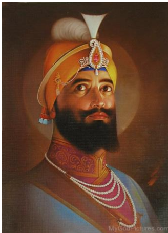
گورو گوپیند سینگ