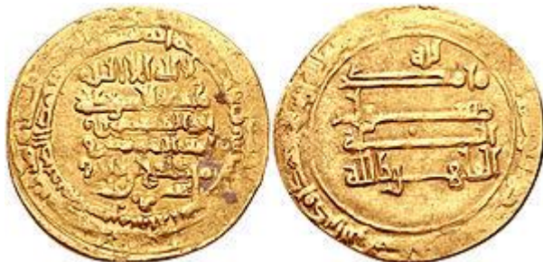
و مرداویج زیاری (زیر)