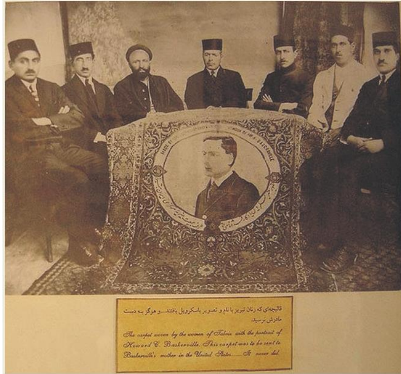
قالی ای با نقش باسکرویل که زنان تبریز برای سپاس از او بافتند و برای مادرش فرستادند

سی و یکم در ضمن زادروز هیتلر هم هست و از این رو دو رخداد مهم زندگی اش در این روز رخ داده است. یکی آن که در ۱۳۱۸ جشن تولد پنجاه سالگی اش در آلمان با مراسمی بزرگ جشن گرفته شد، و دیگر آن شش سال بعد (۱۳۲۴) در همین روز برای آخرین بار از پناهگاهش بیرون رفت و در مراسمی محقرانه به نوجوانان عضو سازمان جوانان هیتلری مدال صلیب آهن داد و چندی بعد خودکشی کرد. رخدادهای سیاسی این روز هم مهم بوده‌اند. در ۱۱۷۱ با اعلان جنگ فرانسه به شاه بلغارستان و بوهمی جنگهای انقلابی فرانسه آغاز شد، در ۱۱۸۹ حاکم کاراکاس اعلام استقلال کرد و ونزوئلا از اسپانیا جدا شد، و در ۱۳۲۵ لیگ ملل منحل شد و سازمان ملل جایش را گرفت.