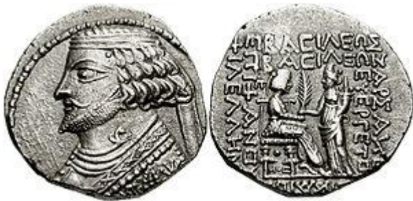
سکه‌ی فرهاد چهارم (بالا)

در جریان همین جنگها و دو سال بعد (۸۶ پ.م) بود که سرداری رومی به نام سولا که با مهرداد می‌جنگید، آتن را گرفت و مردم شهر را کشتار و معبدهای شهر را غارت کرد و آثار هنری آن را که در دوران زمامداری بطلمیوسیان با پول مردم مصر در آتن ساخته شده بود، یکسره ویران ساخت. چهل سال بعد در فروردین سال ۲۶ پ.م فرهاد چهارم اشکانی که در ۳۲ پ.م از قدرت عزل شده بود، به ایران شرقی رفت و سکاها را به یاری خواند. سکاها ی خاندان ونون، که بلوچستان را در اختیار داشتند، از او پشتیبانی کردند. به این ترتیب، فرهاد با سپاهی از سکاها به میان‌رودان لشکر کشید و تیرداد دوم را راند و تاج‌وتخت خود را بازپس گرفت. تیرداد به نزد رومیان گریخت.