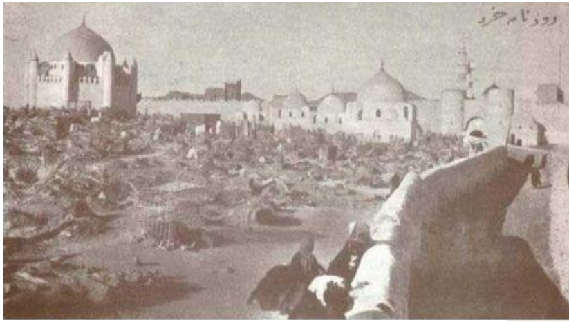
بارگاه گورستان بقیع پیش از آن که به دست وهابی‌ها ویران شود