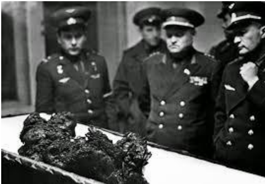
افسران شوروی در کنار بقایای جسد ولادیمیر کوماروف

چهارم اردیبهشت در سرزمینهای دیگر سالروز رخدادهایی بسیار متنوع است. در تاریخ درگیری‌های نظامی اعلان جنگ روسیه به عثمانی در ۱۲۵۶ را داریم و اولین رویارویی تانکها در میدان جنگ (در ۱۲۹۷) را که در ولر برتونو در فرانسه رخ داد و طی آن سه تانک انگلیسی و سه تانک آلمانی با هم درگیر شدند.