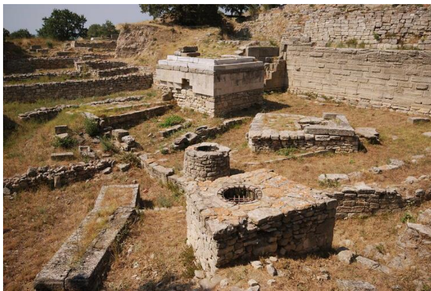
بقایای ویرانه‌های شهر تروا

چهارم اردیبهشت با دو رخداد مهم در جهان باستان گره خورده است. نخست آن که در این روز (به سال ۱۴۷۹ پیش از میلاد) توت‌موس دوم فرعون مصر درگذشت و پسرش توت‌موس سوم به جای او بر تخت نشست، اما چون خردسال بود ملکه‌ی پدرش حت‌شپ‌سوت به همراه او به قدرت رسید و در عمل تا بیست و دو سال بعد قدرت را در اختیار خود گرفت و مشهورترین و تنها فرعون زن در مصر باستان شد. به روایتی حدود سه قرن بعد در همین روز (به سال ۱۱۸۴ پ.م) شهر تروا به دنبال هجوم پیاپی یونانی‌ها سقوط کرد و با خاک یکسان شد، که به روایت هرودوت نخستین درگیری نظامی میان شرق و غرب و ایرانیان و یونانیان قلمداد شده است.