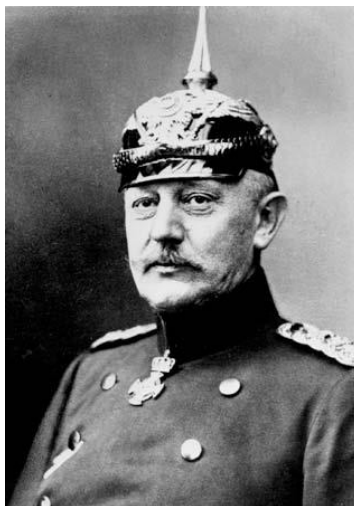
هلموت فون مولتکه