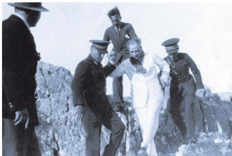
آتاتورک در تونسلی، ۱۳۱۶

ناپایدار افغانستان که از همان هنگام با پشتیبانی انگلیسی‌ها در افغانستان شکل گرفت تا به امروز دوام آورده و مایه‌ی رنج و ویرانی فراوان در این سرزمین شده است. هرچند مدام انگلستان و روسیه و آمریکا اشغال نظامی می‌شود و دودمان پادشاهی کم‌دوامش هم چندان نپایید. طوری که آخرین پادشاهش امان‌الله خان افغان که سومین پسر حبیب‌الله خان از دودمان بارکزی بود، پس از شکست در برابر حبیب‌الله کلکانی به قندهار و از آن جا به ایتالیا رفت و همانجا در پنجم اردیبهشت ۱۳۳۹ درگذشت.