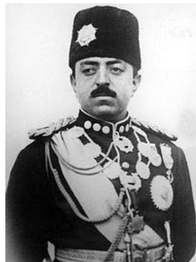
امان‌الله خان افغان

سرزمینهای خارج از قلمرو ایران زمین که از فرهنگ ایرانی برخوردار بوده‌اند نیز در این روز مورد حمله قرار گرفته‌اند. در ۸۷۱ آخرین دولت اسلامی اسپانیا در غرناطه (گرانادا در اسپانیا) سقوط کرد. بیش از چهارصد سال بعد (در ۱۲۹۴) با حمله‌ی قوای متحد انگلستان (سربازان استرالیایی، هندی، فرانسوی و نیوزلندی) به سواحل