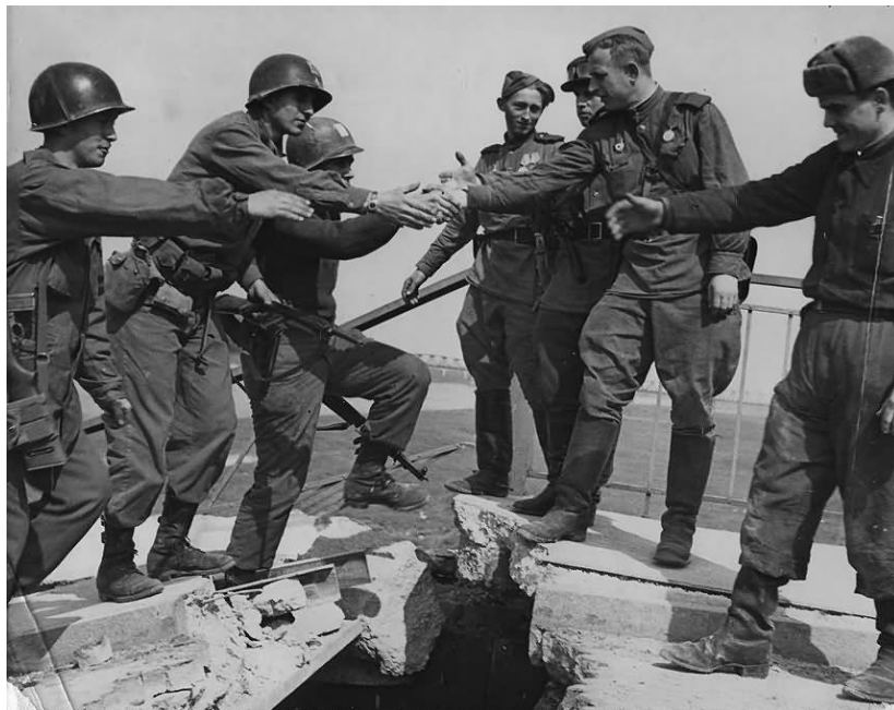
به هم رسیدن سربازان روسی و آمریکایی در الب

خارج از دایره‌ی جنگ و خونریزی نیز پنجم اردیبهشت روزی پراشتهاب در تاریخ معاصر ایران زمین بوده است. در پنجم اردیبهشت ۱۲۸۴ بازرگانان تهران بست‌نشینی سرنوشت‌سازشان برای طلب مشروطه را در شاه‌عبدالعظیم آغاز کردند. ده سال بعد در همین روز (۱۲۹۴) در گرماگرم جنگ جهانی اول پرنس رويس و گراف لکوتتی که نمایندگان آلمان و اتریش بودند به قم و تهران آمدند و مردم ایران که به خاطر نفرت از انگلیسی‌ها هوادار آلمانی‌ها بودند استقبال چندان باشکوهی از ایشان به عمل آوردند که خشم و اعتراض روسها و انگلیسی‌ها را برانگیخت. در همین روز به سال ۱۳۱۹ آئین گشایش رادیو تهران انجام شد.