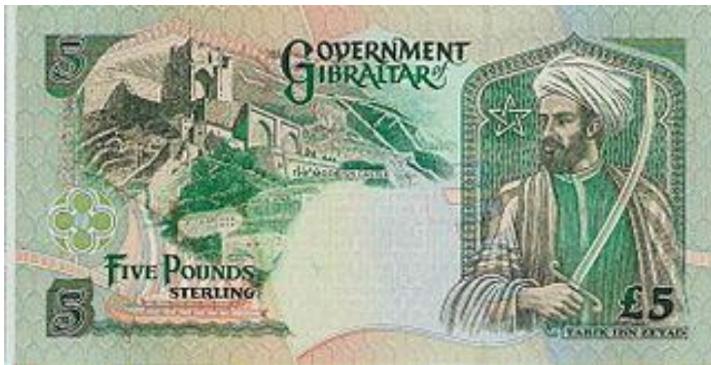
نگاره‌ی طارق بن زیاد بر پول پنج پوندی ایالت جبل‌الطارق

هفتم اردیبهشت در تاریخ ایران زمین با عزل و نصبهای سیاسی و رایزنی‌های دیپلماتیک مصادف افتاده است. اردشیر سوم شاه خردسال ساسانی در این روز (سال هشتم هجری) طی دسیسه‌ای به قتل رسید و سرداری نیرومند به نام شهریراز که بانی مرگ او بود به جایش تاج بر سر نهاد و خود را شاهنشاه خواند. در همین روز به سال ۹۰ سرداری ایرانی از اهالی همدان که پس از اسلام آوردن نام خود را به طارق ابن زیاد تغییر داده بود، فرماندهی سپاهیان اسلام را بر عهده گرفت و از جبل الطارق گذشت و فتح اسپانیا را آغاز کرد. باز در همین روز (در سال ۲۸۵) بود که زکویه قرمطی در قادسیه بر مسلمانان خروج کرد و کاروانی که به حج می‌رفت را غارت کرد.