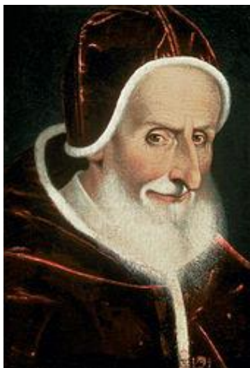
پاپ پیوس پنجم