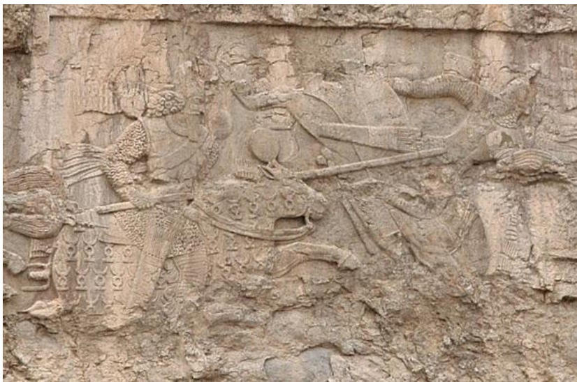
نبرد اردشیر و اردوان در نبرد هرمزدگان، صخره‌نگاره‌ی فیروزآباد

این روز در تاریخ ایران زمین بسیار مهم و سرنوشت‌ساز بوده و رخدادهای تعیین‌کننده‌ای در آن رخ داده‌اند. مهمتر از همه آن که در هشتم اردیبهشت سال ۲۲۴ میلادی اردشیر بابکان در جنگ هرمزدگان اردوان پنجم واپسین شاهنشاه اشکانی را به نبرد تن به تن دعوت کرد و بر او که پهلوانی نامدار بود پیروز شد. به این ترتیب دودمان اشکانی از شاهنشاهی ایران کنار رفت و دودمان ساسانی جانشین آن شد. هرچند خویشاوندی‌ای میان این دو برقرار بود و شاه بعدی ساسانی که شاپور نخست باشد، مادری اشکانی داشت.