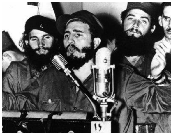
سخنرانی مشهور فیدل کاسترو

اما یازدهم اردیبهشت در جهان به ویژه به خاطر رخدادهای اجتماعی و فرهنگی و علمی اش اهمیت دارد. در ۱۱۳۲ کتاب رده‌بندی گیاهان نوشته‌ی لینه انتشار یافت و نظام نامگذاری علمی گیاهان و جانوران به شکل امروزی زاده شد. در ۱۱۵۵ کشیشی یسوعی به نام آدام وایزهاوپت در باواریا آیین ایلومیناتی را تاسیس کرد و این همان است که امروز همچون فرقه‌ای مرموز و مخوف موضوع داستانهای هیجان‌انگیز قرار گرفته است. ده سال بعد (۱۱۶۵) مونتسارت برای نخستین بار «عروسی فیگارو» را در وین اجرا کرد و در ۱۲۱۹ اولین تمبر پستی موسوم به پنی سیاه در انگلستان رواج یافت. در ۱۲۲۳ اداره‌ی پلیس کنگ تاسیس شد، که دومین سیستم پلیسی مدرن دنیا و اولین در آسیا بود. در ۱۲۳۰ نمایشگاه کریستال پالاس لندن به دست ملکه ویکتوریا افتتاح