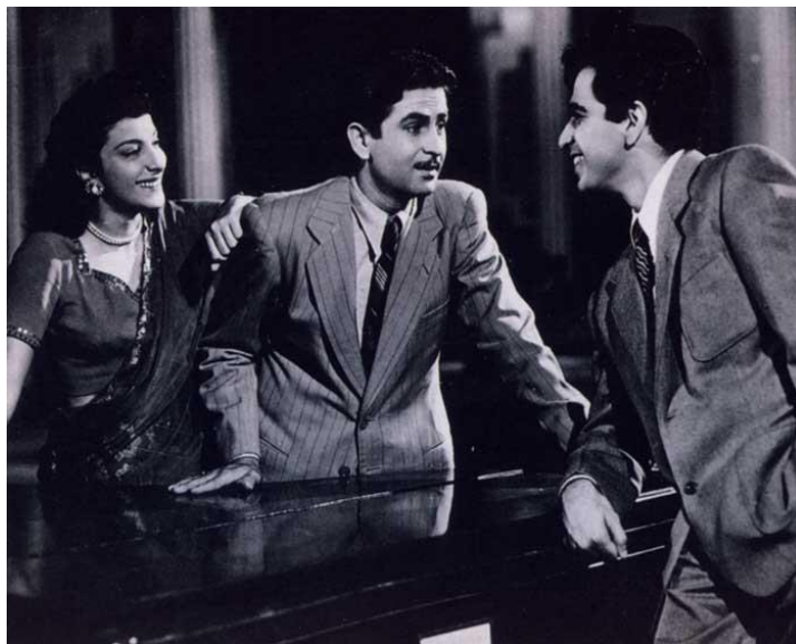
نرگس، راج کاپور و دیلیپ کومار در صحنه‌ای از فیلم «انداز»

در سرزمینهای پیرامونی ایران زمین دو شخصیت در این روز زاده شده‌اند. یکی امان‌الله خان شاه افغانستان