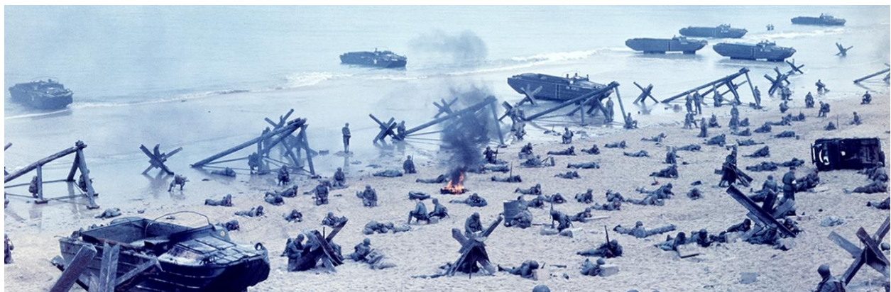
D-Day: تهاجم متفقین به اروپا

تا سه سال بعد نظم و ترتیب بار دیگر در ایران حاکم شده بود و به این ترتیب بود که در همین روز به سال ۱۳۰۳ قانون نظام وظیفه‌ی عمومی تصویب شد. سه سال بعد در ۱۳۰۶ دولت نوپای پهلوی برنامه‌ای برای توسعه به مجلس پیشنهاد کرد که سید حسن مدرس طی نطقی مفصل با آن مخالفت کرد. اما برنامه با ۹۳ رای مثبت تصویب شد. سال بعدش (۱۳۰۷) امیر امان الله خان پادشاه افغانستان به اتفاق همسر خود پس از سیاحت در کشور های اروپائی وارد تهران شد و از موسسات فرهنگی و نظامی دیدن کرد. چندی بعد در شانزدهم خرداد ۱۳۱۴ برای اولین بار در ایران طی یکی از نشستهای مجلس چهاردهم حاضران کلاههایشان را در اتاق برداشتند. تا پیش از آن واژگونی سنت اروپایی، در ایران برهنه شدن سر بی ادبی محسوب می شد و نمایندگان مجلس با کلاه و دستار نشستها را برگزار می کردند. در همین روز به سال ۱۳۲۱ انگلیسی ها پس از سرنگون کردن دولت رشید عالی گیلانی در عراق که هوادار آلمان نازی بود، هوادارانش را محاکمه‌ی نظامی کردند و سه تن را اعدام کردند و بقیه را به زندانهای طولانی محکوم کردند.