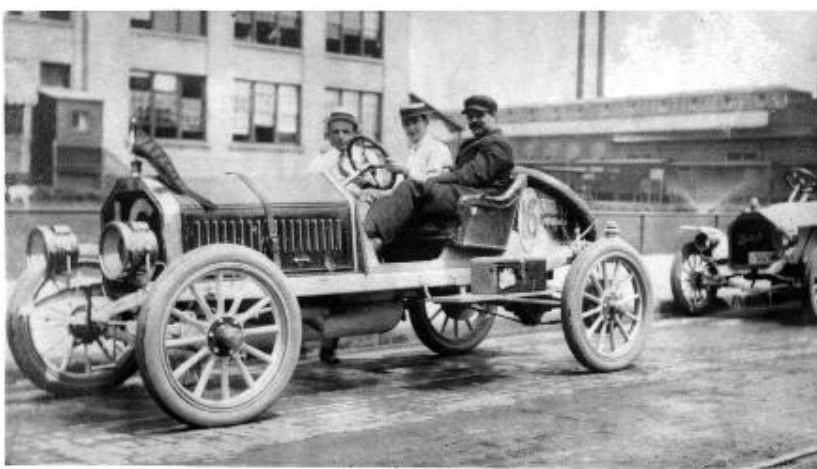
لویی شورولت و اولین نمونه‌ی خودروی بوئیک در سال ۱۲۸۰ (۱۹۰۰م.)

در تاریخ معاصرمان شانزدهم خرداد با D-Day برابر است. یعنی در چنین روزی به سال ۱۳۲۳ بود که