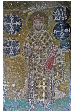
الکساندر سوم امپراتور بیزانس