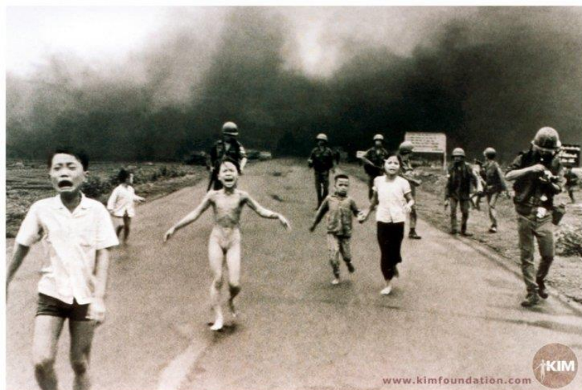
پان تی کیم پوک در کودکی و میانسالی

در میان زادگان نامدار این روز باید از بین ایرانیان از سعید نفیسی (۱۲۷۴) یاد کرد. توماسو آلبینونی