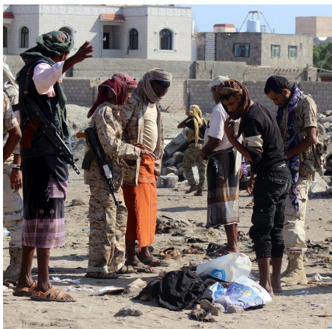
قربانیان بمب‌گذاری انتحاری داعش در یمن

در همین روز به سال ۸۰۹ قوای بورگوندی ژاندارک را اسیر کردند، و او نیز ادعای ارتباط با عالم بالا را داشت و انگلیسی‌ها به همین بهانه به شکلی دلخراش اعدامش کردند. در ۸۷۷ هم کشیشان جیرونامو ساوونارولا مصلح اجتماعی ایتالیایی که او هم مدعی کشف و شهود بود را به جرم کفر بر تیرک بستند و سوزاندند. نسخه‌ای ابلهانه از همین جانفشانی‌ها در راه الهام و اوهام به سال ۱۳۸۵ رخ داد و آن زمانی بود که دو بمب‌گذار انتحاری داعشی در یمن خود را منفجر کردند و ۴۵ نفر که برخی‌شان سربازان ارتش یمن بودند را همراه خود کشتند. در همین روز هشت انتحاری دیگر در جبله و طرسوس (در سوریه) خود را منفجر کردند و ۱۸۴ شهروند را کشتند و دویست تن دیگر را به سختی زخمی کردند.