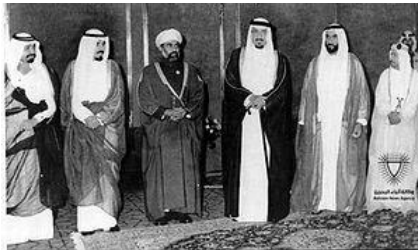
شش شیخ عرب در شورای همکاری شان

در ۱۳۲۹ دکتر مصدق در جریان کشمکش بر سر ملی شدن صنعت نفت، به بازنشستگی اجباری فضل‌الله زاهدی به دست رزم‌آرا اعتراض کرد و شاه که با رزم‌آرا دشمنی داشت از او هواداری کرد و زاهدی را به سناتوری برگزید. در ۱۳۲۵ مجلس اردن امیر عبدالله اول را به حکومت برگزید، و در ۱۳۶۰ در گرماگرم جنگ ایران و عراق شورای همکاری خلیج فارس در ریاض خلق شد. این شورا از عربستان، بحرین، کویت، قطر، عمان، و امارات تشکیل شده بود و کشورهایی با پیشینه‌ی چند ده سال را شامل می‌شد که پیشتر مستعمره‌ی انگلستان بودند و حالا قرار بود پول نفتشان را برای فرسودن توان نظامی ایران به اروپا بفرستند و برای عراق اسلحه بخرند. رخدادهای سیاسی دیگر این روز آن که در ۱۱۸۹ مردم بوئنوس آیرس شورش کردند و جنگهای استقلال آرژانتین شروع شد، و در ۱۲۷۴ جمهوری فرمز (تایوان) تشکیل شد.