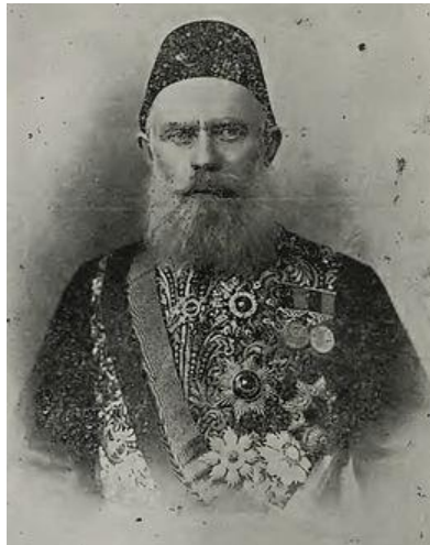
احمد جودت پاشا

روز چهارم خرداد در ضمن ارتباطی با آسمان و سفرهای فضایی واقعی و مجازی هم پیدا می‌کند. چون در ۱۳۴۰ کندی در سخنرانی‌اش در کنگره گفت تا پیش از پایان دهه انسان به ماه خواهند فرستاد، و در نتیجه شانزده سال بعد (۱۳۵۶) فیلم مشهور جنگ ستارگان اکران شد! در همین روز به میمنت این ماجرا دولت چین ممنوعیت آثار شکسپیر را برداشت و به این ترتیب انقلاب فرهنگی خاتمه یافت. نزدیک ده سال بعد از ماجراها برنامه‌ی تلویزیونی دیرپا و مشهور اوپرا آغاز شد که تا چهارم خرداد ۱۳۹۰ ادامه داشت و در این روز وینفری اوپرا آخرین بخش از برنامه‌اش را پس از بیست و پنج سال اجرا کرد.