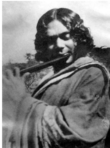
قاضی ناظرالاسلام بنگالی