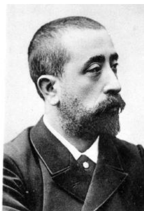
ژیل دو لا توره

درگذشتگان نامدار دیگر این روز عبارتند از امیر عبدالقادر که شاگرد شیخ عبدالرحمن علیش الکبیر و رئیس نهضت مقاومت الجزایر بود و در ۱۲۶۲ در دمشق درگذشت. ژیل دو لا توره پزشک فرانسوی (۱۲۸۳)، میرزا غلام احمد بنیانگذار مذهب احمدیه (۱۲۸۷)، مارتین هایدگر فیلسوف (۱۳۵۵)، سیدنی پولاک هنرپیشه و کارگردان (۱۳۸۷) و هوشنگ سیحون معمار (۱۳۹۳) هم در این روز از دنیا رفتند.