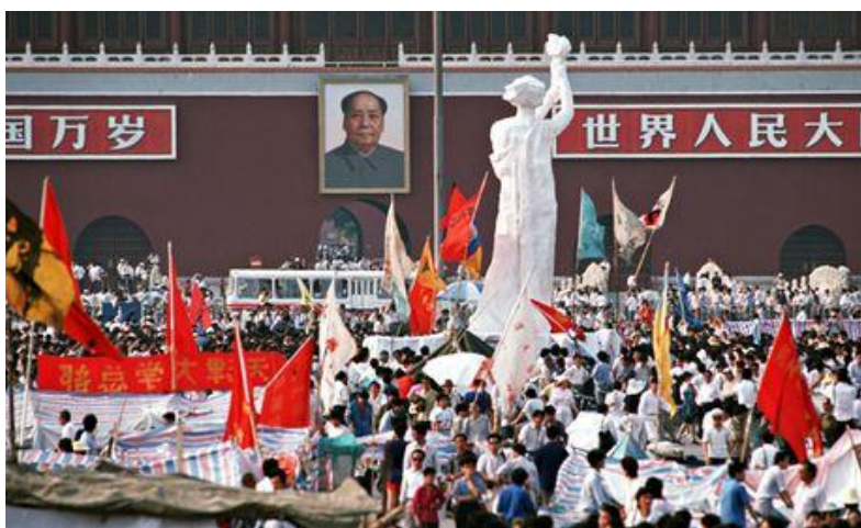
مجسمه‌ی آزادی (ایزدبانوی دموکراسی) که دانشجویان در میدان تیان‌آن‌من ساخته بودند

این روز در ضمن با خشونت‌هایی هم قرین بوده است. در ۱۲۰۵ اندرو جکسون که بعدتر رئیس جمهور آمریکا می‌شد، در دوئل مردی به اسم چارلز دیکینسون را به قتل رساند. در ۱۳۲۱ هزار بمب افکن انگلیسی کولونی در آلمان را بمباران کردند و کل شهر را با خاک یکسان کردند. یک سال بعد در ۱۳۲۲ یوزف منگله ریاست بخش پزشکی آشویتس را بر عهده گرفت و بیش از دو سال در این مقام باقی بود. او به خاطر آزمایش‌های غیرانسانی‌ای که بر زندانیان انجام می‌داد در تبلیغات ضدآلمانی انگلیسی‌ها موقعیتی مرکزی پیدا کرد، هرچند دورانی که این جنایتها را مرتکب می‌شد به نسبت کوتاه بوده است. در سالهای اخیر در همین روز کودتا در برمه را داشته‌ایم. در ۱۳۸۲ بیش از هفتاد نفر از اعضای لیگ ملی دموکراسی در برمه به دست ارتشی‌ها کشته شدند، و رهبرشان آنگ سان سوچی گریخت اما دستگیر شد.