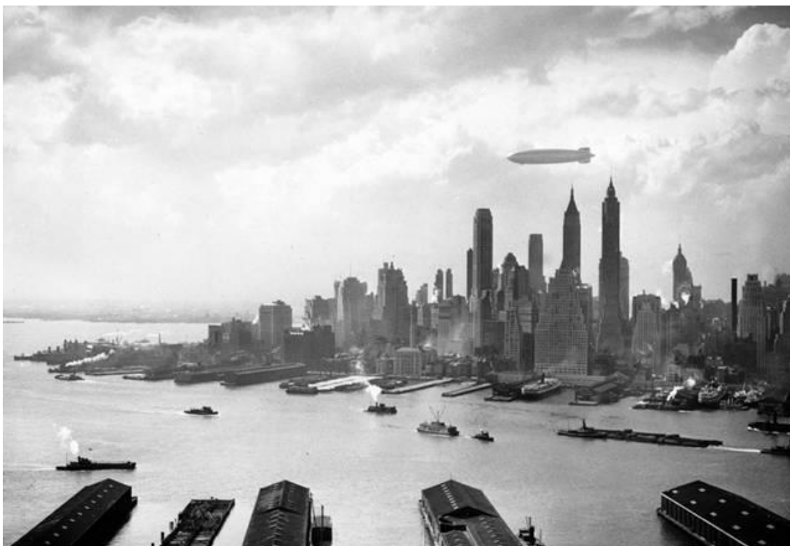
هوانورد هیندنبورگ بر فراز مانهاتان، دقایقی پیش از سقوط

در سطح جهانی این روز از طرفی با حرکات نظامی اسپانیایی‌ها پیوندی دارد. در شانزدهم اردیبهشت سال ۹۰۶ خورشیدی لشکریان اسپانیایی و آلمانی رم را اشغال کرده و به باد غارت دادند، که برخی از مورخان این حادثه را نقطه‌ی پایان دوران نوزایی می‌دانند. نُه سال بعد (۹۱۵) در همین روز اسپانیایی‌ها در گوشه‌ی دیگری از دنیا قلمرو سرخپوستان را اشغال کرده و در حال غارت آن بودند که سرخپوستان اینکا پاتکی زدند و شهر کوزکو که پایتختشان بود را محاصره کردند و کوشیدند آنجا را از اسپانیایی‌های مهاجم پس بگیرند، که البته ناکام ماندند.