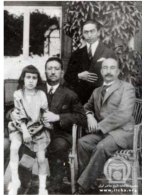
محمدعلی شاه در پایان عمر

زادگان نامدار شانزدهم اردیبهشت عبارتند از ماکسیمیلیان روبسپیر انقلابی فرانسوی (۱۱۳۷)، زیگموند فروید (۱۲۳۵)، و دکتر ذبیح الله صفا که به سال ۱۲۹۰ در شه میرزاد سمنان به دنیا آمد. رفتگان این روز چندین چهره‌ی نامدار ایرانی را در بر می‌گیرند. محمدعلی شاه سلطان مستبد و ضدمشروطه‌ی قاجار در ۱۳۰۳ در پاریس با مرض قند درگذشت، در ۱۳۴۹ بدیع‌الزمان فروزانفر که از بزرگترین ادیبان معاصر کشورمان بود فوت کرد، و در ۱۳۵۴ یکی از چریکهای مجاهدین به نام مجید شریف واقفی که گرایش اسلامی داشت به دست دوستان چریکش که گرایش کمونیستی داشتند به قتل رسید و اسم دانشگاه شریف که محل تحصیلش بود را بر این اساس برگزیده‌اند. در همین روز به سال ۱۲۹۵ جمال پاشا حاکم عثمانی بیروت بیست و یک لبنانی جدایی طلب را در