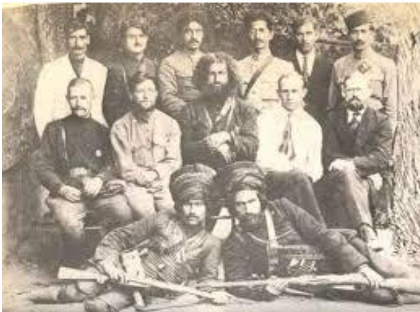
میرزا کوچک خان و اعضای

شانزدهم اردیبهشت در تاریخ ایران زمین با جنب و جوشهای سیاسی بزرگ و درگذشت مردان نامدار همزمان است. در تاریخ قرون اخیر در سال ۱۲۰۲ پیروزی سیکها بر یارمحمد خان افغان را در این روز داریم که به تسخیر پشاور به دست سیکها انجامید و به تشکیل یک دولت زودگذر سیک در پاکستان امروزی انجامید. هشت دهه بعد جریان مشروطه در ایران آغاز شد و در همین روز (۱۲۸۸) علیقلی سردار اسعد از اروپا به ایران بازگشت و رهبری بخشی از قوای مشروطه‌خواه که با شاه مستبد می‌جنگیدند را بر عهده گرفت. ده سال امان‌الله خان به قوای اشغالگر انگلیسی حمله برد و دو سال بعد (۱۳۰۰) کمیته‌ی انقلاب گیلان با حضور میرزا کوچک خان و خالو قربان و احسان‌الله خان و حیدر خان عمو اوغلو برای نخستین بار تشکیل جلسه داد.