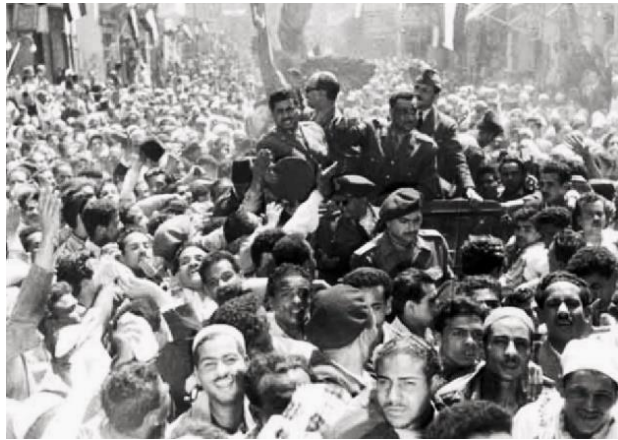
انقلابیون مصری در حین اعلام جمهوری

عبارتند از گئورگی ژوکف ژنرال روسی (۱۳۵۳) و خوزه ساراماگو نویسنده (۱۳۸۹).