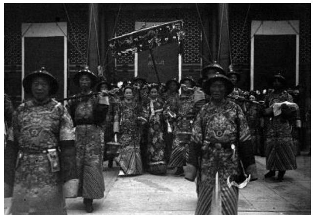
ملکه سی‌چی در حدود زمان اعلام کشتار بیگانگان در چین