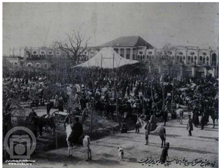
هجوم روسها و محاصره‌ی استانبول