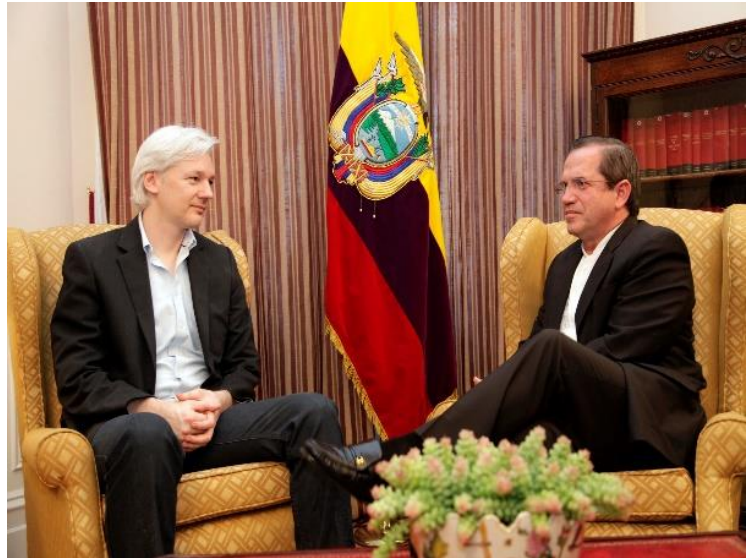
جولین آسانز در سفارت اکوادور

۲۹ خرداد در ضمن روز آغاز چیزهای مشهور نوپدید هم هست. در ۱۲۲۵ اولین بازی رسمی بیسبال در