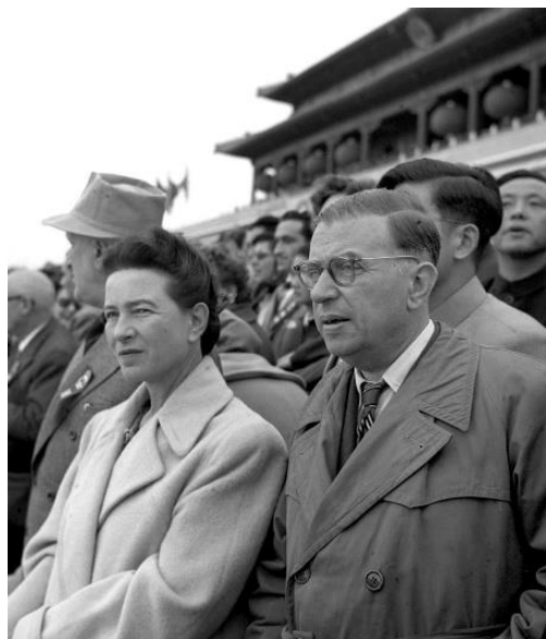
ژان پل سارتر

تبرئه شد! در ۱۳۸۵ دو ماه نیکس و هیدرا در اطراف پلوتو کشف شدند.