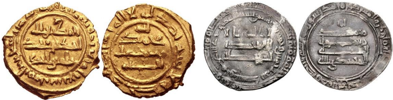
سکه‌ی احمد بن محمد صفاری سیستانی