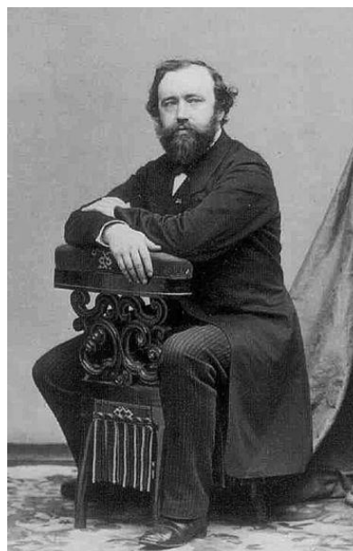
آدولف ساکس و ساکسیفونش