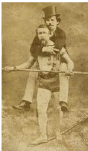
شارل بلوندن و مدیر برنامه‌هایش!

گذشته از اینها چند رخداد جالب توجه دیگر هم در این روز واقع شده است. یکی آن که در ۱۲۳۸ شارل بلوندن بندباز فرانسوی از روی طنابی که بر آبشار نیاگارا بسته شده بود گذشت، دیگری آن که در ۱۲۶۵ اولین قطار میان‌قاره‌ای کانادا که عرض قاره را می‌پیمود از مونترآل به مقصد پورت مودی به حرکت درآمد. سوم این که در ۱۳۱۶ اولین شماره تلفن امدادسانی اضطراری (۹۹۹) در لندن به کار افتاد. در نهایت در نهم تیر ۱۳۵۰ بود که سرنشینان سفینه‌س سوئوز ۱۱ به خاطر نشست هوای کابین‌شان به فضا کشته شدند.