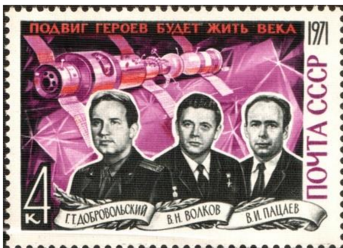
تمبر یادبود فضانوردان سوئوز ۱۱