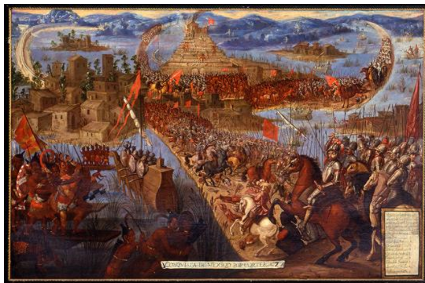
هجوم اسپانیایی‌ها به تنوتچیتلان

این روز برای کوشندگان هوادار مقاومت در برابر استعمار و سیطره‌ی قدرت هم پر ماجرا بوده است. در ۱۳۱۵ امپراتور حبشه هایله سلاسی در مجمع ملل حضور یافت و به حمله‌ی ایتالیا به کشورش اعتراض کرد و سخنرانی‌اش بسیار مورد توجه قرار گرفت. در ۱۳۳۹ کنگو از بلژیک استقلال یافت، در ۱۳۴۵ سازمان ملی زنان که بزرگترین انجمن زن‌گرای آمریکاست تاسیس شد و در ۱۳۶۹ بعد از چهار دهه جداسازی زورمدارانه‌ی دوران جنگ سرد، اقتصاد آلمان شرقی و غربی ادغام شد. در ۱۳۷۶ هم انگلستان حاکمیت هنگ کنگ را به دولت چین بازگرداند.