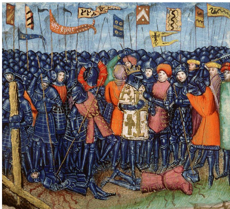
نبرد حطین در یک نقاشی