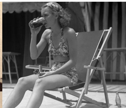
جین وایمن هنرپیشه -۱۳۱۴

در روز چهاردهم تیر ماه المستنصر بالله خلیفه‌ی فاطمی (۴۰۸) و بارنوم بنیانگذار سیرک مشهور (۱۱۸۹) و ژرژ پپیدو سیاستمدار فرانسوی (۱۲۸۰) زاده شدند و والتر گروپیوس فیلسوف روابط بین‌الملل (۱۲۴۸) درگذشت.