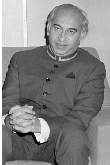
ذوالفقار علی بوتو