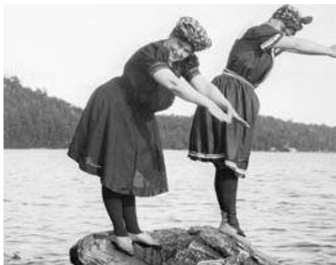
لباس شنا در حدود ۱۲۸۰

چهاردهم تیر ماه از نظر فرهنگ عامه و سبک زندگی هم روز مهمی است. نشانه‌اش آن که در ۱۳۲۵ اولین بیکنی به بازار عرضه شد، در ۱۳۳۳ بی بی سی اولین بولتن خبری‌اش را از تلویزیون پخش کرد، و در "That's All Right" را ضبط کرد. در ۱۳۹۱ هم برج شاردر لندن با ۳۱۰ متر بلندا افتتاح شد و مرتفع‌ترین ساختمان اروپا شد.