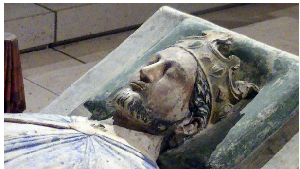
راست: ریچارد شیردل؛

چپ: سوزانده شدن ژان هوس بر اساس نقاشی‌ای از قرن ۱۵