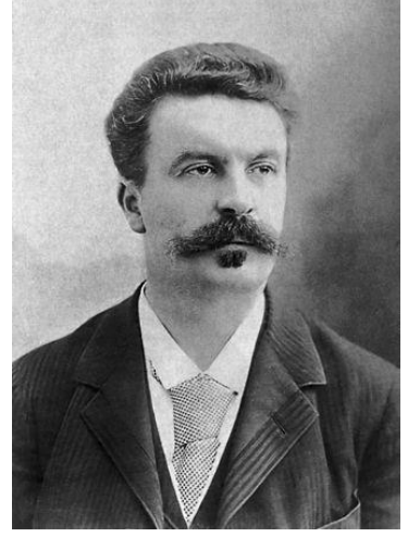
گی دو مویاسان