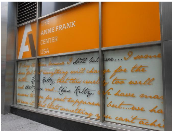
شعبه‌ای از موسسه‌ی بزرگ و متمول انتشار آثار آن فرانک

بود که این دفترچه خاطرات را جعلی می‌دانستند. تمام دادگاههایی که برای شکایتهای او برگزار می‌شد به نفع او رای می‌دادند اما درباره‌ی مدعیان جعلی بودن این سند هم نرمخوبی جالب توجهی نشان می‌دادند و فقط اصرار بر این بود که چنین حرفی دیگر تکرار نشود. با این همه شواهد فراوانی در دست است که نشان می‌دهد کل ماجرای این دفترچه خاطرات تبلیغاتی سیاسی بوده و به احتمال زیاد دختری با نام و نشان آن فرانک مشهور هرگز وجود نداشته است.