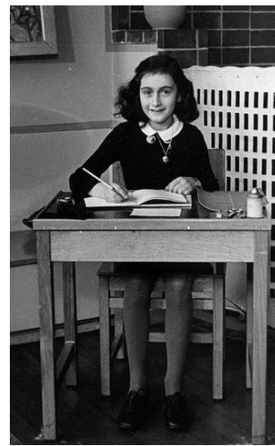
تصویر منسوب به آن فرانک

زادگان نامدار پانزدهم تیرماه عبارتند از مارک بلوخ فیلسوف و مورخ (۱۲۶۵)، مارک شاگال نقاش (۱۲۶۶)، فریدا کالو نقاش مکزیکی (۱۲۸۶)، تنزین گیاتسو چهاردهمین دالای لاما (۱۳۱۴)، و نورسلطان نظربایف اولین رئیس جمهور قزاقستان (۱۳۱۹). گی دو موپاسان نویسنده‌ی فرانسوی (۱۲۷۲) و عزیز نسین طنزنویس ترکیه (۱۳۷۴) هم در این روز درگذشته‌اند.