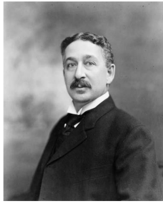
کینگ کمپ ژیلت