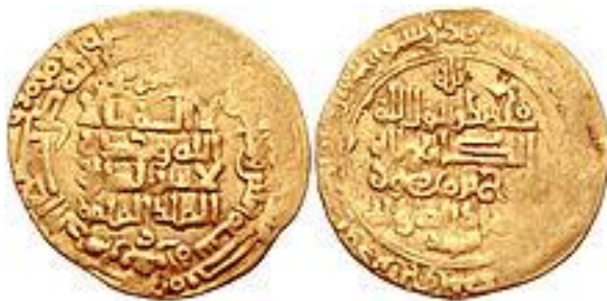
سکه‌ی نوح بن منصور سامانی

(۳۷۶) و محمد ظاهر شاه افغان (۱۳۸۶) هم در این روز در گذشته‌اند.