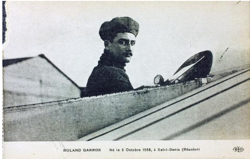
بالا: رولن گارو؛ چپ: نستوریوس

دوازدهم امرداد در تاریخ جنگ هم اهمیتی نسبی دارد. در سال ۱۲۹۳ در جریان اولین جنگ جهانی اول، نخستین نبرد هوایی رخ داد که طی آن خلبانی فرانسوی به نام رولان ژرژ گارو هواپیمای خود را به یک کشتی هوایی (زپلین) آلمانی کوبید و آن را منهدم کرد. در ۱۳۱۹ ارتش ایتالیا به سومالی که مستعمره‌ی انگلستان بود حمله برد، و در ۱۳۳۹ نیجریه از فرانسه استقلال یافت. در ۱۳۸۴ هم رئیس جمهور موریتانی معاویه ولد سید