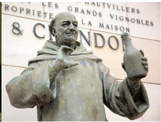
دوم پیر پرینون