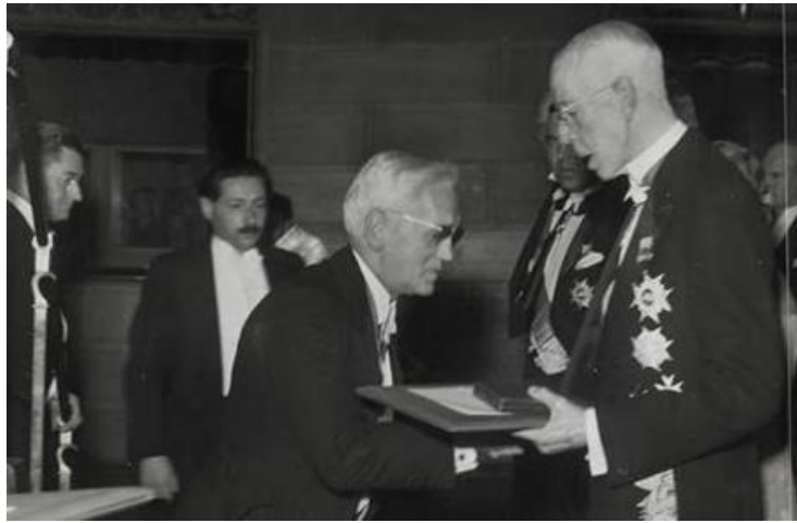
فلمینگ هنگام گرفتن نوبل از شاه سوئد گوستاو پنجم در ۱۳۲۴

در پانزدهم امرداد سال ۱۲۹ هجری خورشیدی مروان دوم خلیفه‌ی اموی پس از شکستهای پیاپی سردارانش از ابومسلم خراسانی در جنگ زاب از سفاح عباسی شکست خورد و به مصر گریخت و در آنجا کشته شد، در سال ۶۰۰ دومینیک قدیس اسپانیایی بنیانگذار فرقه‌ی دومینیکن درگذشت. او نیای فکری تفتیش عقاید قرون وسطا بود. باقی درگذشتگان نامدار این روز عبارتند از بن جانسون شاعر انگلیسی (۱۰۱۶)، دیگو وساکوئز نقاش اسپانیایی (۱۰۳۹)، تئودور آدورنو (۱۳۴۸)، پاپ پل ششم (۱۳۵۷) و شاپور بختیار آخرین نخست‌وزیر دوران پهلوی (۱۳۷۰). (تصاویر زیر: چهار نفر اخیر به ترتیب از راست به چپ)