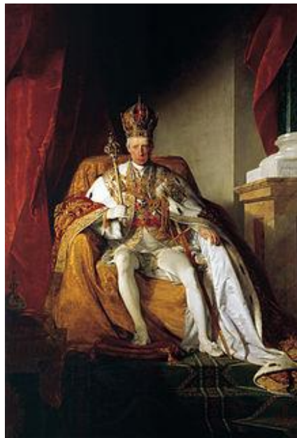
فرانسیس دوم امپراتور مقدس روم

در چنین روزی به سال ۸۸۵ دوک نشین لیتوانی در نبر کلتسک بر خانهای کریمه پیروز شد، در ۹۱۷ گونزالو خیمنز د کوئسادا در کلمبیای امروزیین شهر بوگوتا را بنیان نهاد که در آغاز اردوگاه ماجراجویان و غارتگران اسپانیایی بود. ۱۱۸۵ فرانسیس دوم کناره گیری کرد و به این ترتیب امپراتوری مقدس روم منحل شد و امپراتوری اتریش جای آن را گرفت. در ۱۲۰۴ بولیوی از اسپانیا استقلال یافت و در ۱۲۴۰ انگلستان لاگوس در نیجریه را تسخیر کرد و به خاک خود منضم ساخت.