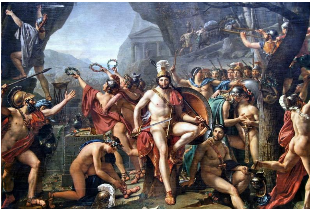
لئونیداس در ترموپولای اثر داوید، نقاش دربار ناپلئون

حدود دو هزار و پانصد سال پیش در چنین روزی، به سال ۴۸۰ پیش از میلاد یک رسته از سپاهیان ایرانی که برای فتح آتن در یونان پیشروی می‌کردند، در تنگه‌ی ترموپولای (ترموپیل) با مقاومت یونانی‌هایی روبرو شدند که به روایتی رهبری‌شان را اسپارتی‌ها بر عهده داشتند. یونانی‌ها تا سه روز کوشیدند راه پیشروی ایرانیان را سد کنند. اما در بیستم مرداد فرماندهی اسپارتی‌شان لئونیداس در جنگ کشته شد و باقی‌گriختند و ایرانیان چنان که قرارشان بود رفتند و آتن را گرفتند. اروپاییان از قرن هجدهم به بعد این درگیری کوچک و نافرجام نظامی را مهم دانسته و لئونیداس را همچون قهرمان مقاومت غربیان در برابر نفوذ شرقیان ستوده‌اند.