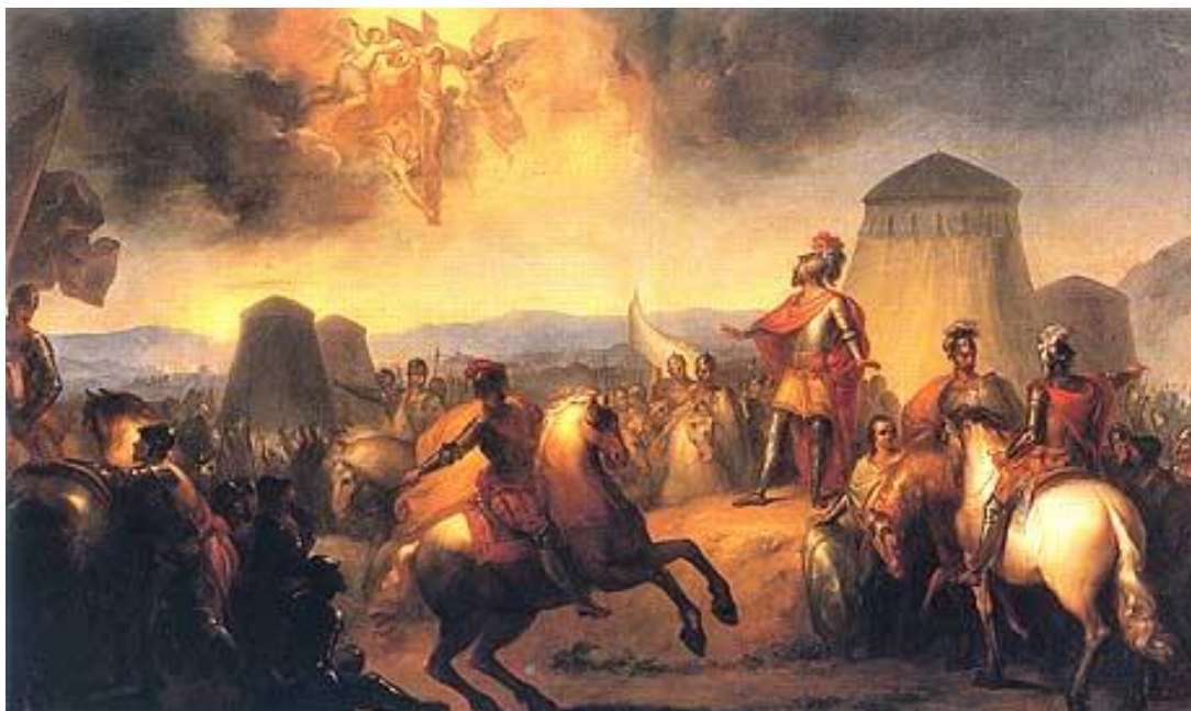
ظهور سنت جیمز بر سپاهیان آلفونسو

نیروهای مرابطون به رهبری علی بن یوسف غلبه کنند. این پیروزی به قدری برای مسیحیان مهم بود که بعدها این افسانه پدید آمد که سنت جیمز در میدان جنگ پدیدار شده و ایشان را یاری رسانده است. طبق همین افسانه‌ها آلفونسو پس از این نبرد خود را شاه قلمرو فتح شده اعلام کرد و به این ترتیب پادشاهی پرتغال زاده شد. در واقع اما این جنگ رخدادی در حاشیه‌ی دولت بزرگ مرابطون محسوب می‌شد و آلفونسو هم در اسناد تاریخی معاصر و تا قرن‌ها بعد پرنس آلفانته نامیده می‌شد و نه چیزی بیشتر.