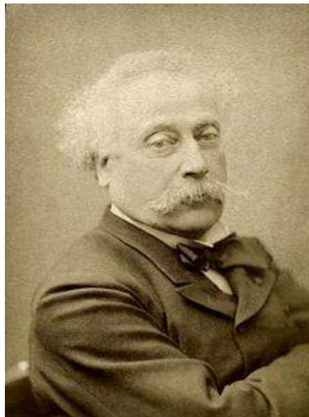
الکساندر دومای پسر

از دانشگاه تورنتو اعلام کرد هورمون انسولین عامل تنظیم قند خون است. در ۱۲۶۹ هم ونسان ون گوگ نقاش مشهور خودکشی کرد. حدود هزار سال پیش از ون گوگ، عبدالله دوم امیر اغلی حاکم بر شمال آفریقا درگذشت و نود سال پس از او محمد رضا شاه پهلوی جان سپرد. زادگان نامدار این روز هم عبارتند از سلطان مراد چهارم عثمانی (۹۹۱)، الکساندر دومای پسر (۱۲۰۳) و ژان بودریار اندیشمند فرانسوی (۱۳۰۸).