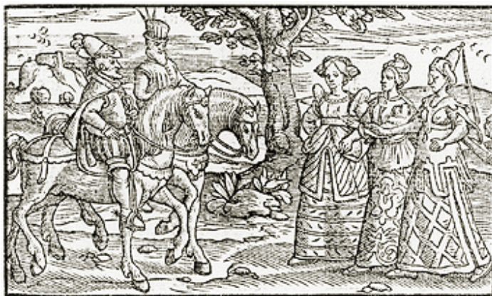
دیدار مکبث و جادوگران در نقاشی‌ای به سال ۹۵۶

این روز در سایر کشورها با تلاطمی در سیاست مصادف بوده است. در ۴۳۳ هجری خورشیدی سیوارد ارل نورتومبریا به اسکاتلند حمله کرد و شاه این قلمرو که مکبث نام داشت را شکست داد. بعدها همین شاه شکست خورده به شخصیت مرکزی نمایشنامه‌ی شکسپیر تبدیل شد.