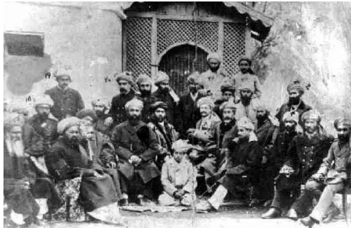
ایوب خان و سرداران پیروز در نبرد میوند