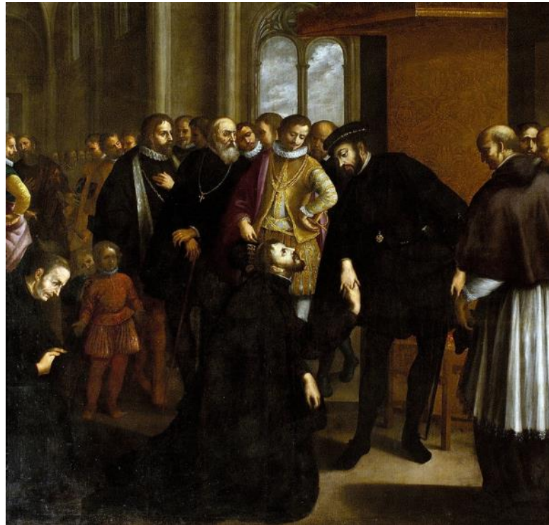
زمانی که گزایه از شاه پرتغال مجوز تبلیغ می‌گیرد

در پنجم مرداد سال ۱۳۰۸ معاهده‌ی ژنو درباره‌ی خوشرفتاری با زندانیان جنگی توسط ۵۳ کشور امضا شد، در ۱۳۳۴ اشغال نظامی اتریش توسط متفقین که از پایان جنگ جهانی دوم همچنان برقرار بود، پایان یافت، و در ۱۳۶۹ بلاروس از اتحاد جماهیر شوروی استقلال یافت، در همین روز «جماعت مسلمین» در ترینیداد و توباگو اقدام به کودتا کرد اما شکست خورد