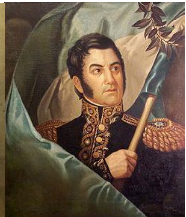
خوزه دو سان مارتین

زادگان نامدار این روز عبارتند از لودویگ فوئرباخ اندیشمند آلمانی (۱۱۸۳)، ارنست کاسیرر فیلسوف (۱۲۵۳)، مارسل دوشان نقاش فرانسوی (۱۲۶۶)، کارل ریموند پوپر فیلسوف اتریشی (۱۲۸۱)، و آن بوردا ناشر و صاحب مجله‌ی مشهور مد بوردا (۱۲۸۸). در قلمرو ایران زمین هم سه چهره‌ی نامدار در این روز به دنیا آمده‌اند که تفاوت‌های چشمگیری با هم دارند. یکی‌شان حسین خان نخجوانی (نخجوانسکی!) زاده شد. او تنها آجدان ژنرال مسلمان ارتش تزاری روسیه بود (۱۲۴۲). دیگری شهیار قنبری خواننده (۱۳۲۹) است و سومی ابوبکر