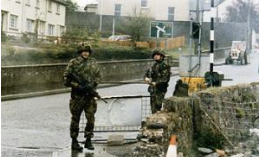
سربازان انگلیسی در ایرلند

نهم امرداد در ضمن سالگرد دو رخداد مذهبی آموزنده هست. در ۸۷۱ هجری خورشیدی به دنبال صدور فرمان الحمرا مسیحیان اسپانیا همه‌ی یهودیان را از شهرها و خانه‌هایشان بیرون راندند، و در ۱۰۸۲ دانیل دفو به خاطر انتشار جزوه‌ای طنز به جرم هتک حرمت مقامات و جریحه‌دار کردن عفت عمومی در غل و زنجیر و قید نهاده شد.