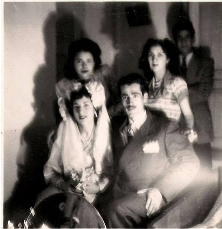
مراسم عروسی فروغ فرخزاد و پرویز شاپور

۱۳۰۷ قانون اصول تشکیلات جدید وزارت عدلیه تدوین و تصویب شود. ده سال بعد در ۱۳۱۷ باستان‌شناسان در تخت جمشید گنجینه‌ای از زر و سیم مربوط به دوران داریوش بزرگ را کشف کردند. دوازده سال بعد در همین روز (۱۳۲۹) پدر فروغ فرخزاد قبول کرد دخترش با پرویز شاپور ازدواج کند و فروغ در نامه‌اش به وی برای نخستین بار تعبیر «پرویز همسر» را به کار برد.