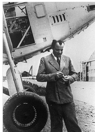
آنتوان سنت دو آگروپری

زادگان نامدار این روز عبارتند از: فریدریش وُهلر شیمی‌دان آلمانی (۱۱۷۹)، میلتون فریدمن اقتصاددان (۱۲۹۱)، و رابرت مرتون جامعه‌شناس (۱۳۲۳). در همین روز به سال ۱۳۲۳ آنتوان دو سنت آگروپری هنگام پرواز شناسایی در جنگ جهانی دوم در شرایطی پرابهام کشته شد، او در جبهه‌ی فرانسه‌ی آزاد (متفقین) پرواز می‌کرد اما بعدتر معلوم شد که دولت ویشی (متحد با نازی‌ها) او را همکار خود را می‌دانسته و ژنرال دوگل هم او را به هواداری از آلمان متهم می‌کرد. گذشته از این نویسنده‌ی محبوب، این کسان نیز در نهم امرداد از دنیا رفتند: دنی دیدرو (۱۱۶۳)، فرانتس لیست آهنگساز (۱۲۶۵) و گور ویدال سیاستمدار و نویسنده‌ی آمریکایی (۱۳۹۱).