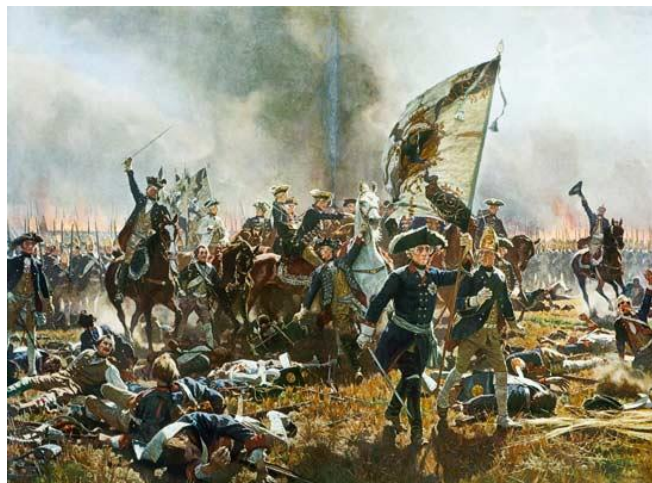
فردریک در نبرد زورندورف

در این روز زاده شده‌اند و فردریک کبیر شاه پروس در چنین روزی به سال ۱۱۶۵ درگذشت.