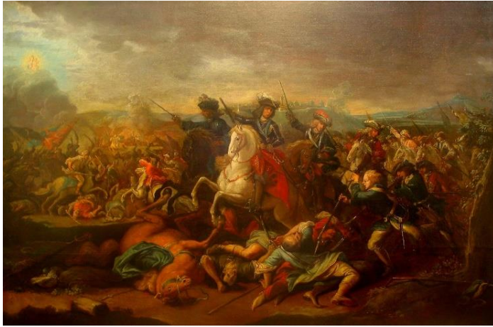
شاهزاده اوژن اهل ساووی در نبرد بلگراد