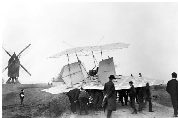
هوایمای کارل یاتو

در این روز گذشته از این فجایع رخدادهای علمی و فنی خوبی هم رخ داده است. در ۱۲۴۷ پیر ژانسن منجم فرانسوی هلیم را کشف کرد، در ۱۲۸۲ مهندسی آلمانی به نام کارل یاتو چهار ماه پیش از برادران رایت هوایمای موتوری خود را به پرواز در آورد. هرچند چون تاریخ فناوری را انگلیسی زبانها نوشته‌اند، برادران رایت امروز شهرت بیشتری دارند. در ۱۳۳۷ رمان لولیتا به قلم ولادیمیر نابوکوف در آمریکا انتشار یافت. نابوکوف این کتاب را در سال ۱۳۳۴ در پاریس به زبان انگلیسی نوشته بود. در ۱۳۴۲ هم جیمز مردیت نخستین سیاهپوستی شد که از دانشگاهی در آمریکا مدرکی می‌گرفت.