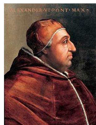
پاپ الکساندر ششم