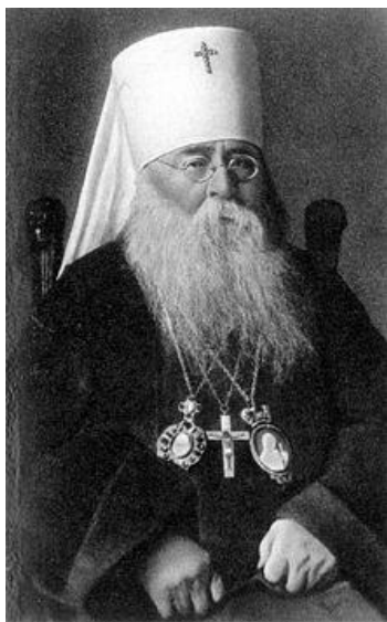
سرگیوس سراسقف مسکو

ارتدوکس به آرمانهای بلشویکها و کمونیستها وفادار است!