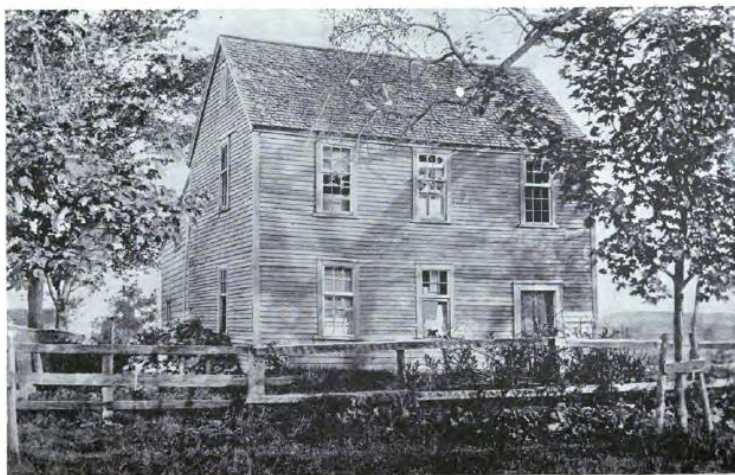
خانه‌ی جادوگران شهر سالم