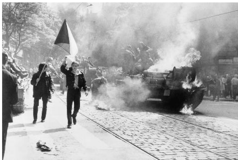
شکست کودتای مسکو

به این ترتیب نمایان است که بیست و نهم امرداد با رخداد‌های سیاسی متنوعی قرین بوده است. در سال ۳۷۹ هجری خورشیدی سنت استغان کشور بلغارستان را تاسیس کرد و اولین شاه این قلمرو شد، در ۸۹۸ سردار نامدار چینی وانگ یانگ مینگ بر سرکرده‌ی شورشیان ژو چن هائو پیروز شد و طغیان شاهزاده‌ی نینگ که بقای سلسله‌ی مینگ را تهدید می‌کرد را فرو نشانده. در ۱۳۳۹ سنگال از فدراسیون مالی جدا شد و اعلام استقلال کرد، در ۱۳۴۷ قوای شوروی با همکاری ارتش لهستان به چکسلواکی حمله بردند و بهار پراگ را سرکوب کردند، و در ۱۳۶۷ با قبول قطعنامه‌ی ۵۹۸ از طرف ایران جنگ تحمیلی خاتمه یافت. در ۱۳۷۰ بیش از صد هزار نفر معترض در اطراف پارلمان مسکو گرد آمدند و کودتای کمونیستها را با شکست روبرو ساختند و در همین روز استونی از شوروی اعلام استقلال کرد. در ۱۳۷۴ دو قطار در خط فیروزآباد به کانپور در نزدیکی دهلی به هم برخورد کردند و باعث مرگ ۳۵۸ نفر شدند، و در ۱۳۹۵ یک قاتل انتحاری در غازیان‌تپه‌ی کردستان ترکیه خود را منفجر کرد و ۵۴ نفر از مهمانان یک عروسی را به قتل رساند.