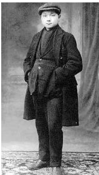
دنگ شیائو پینگ