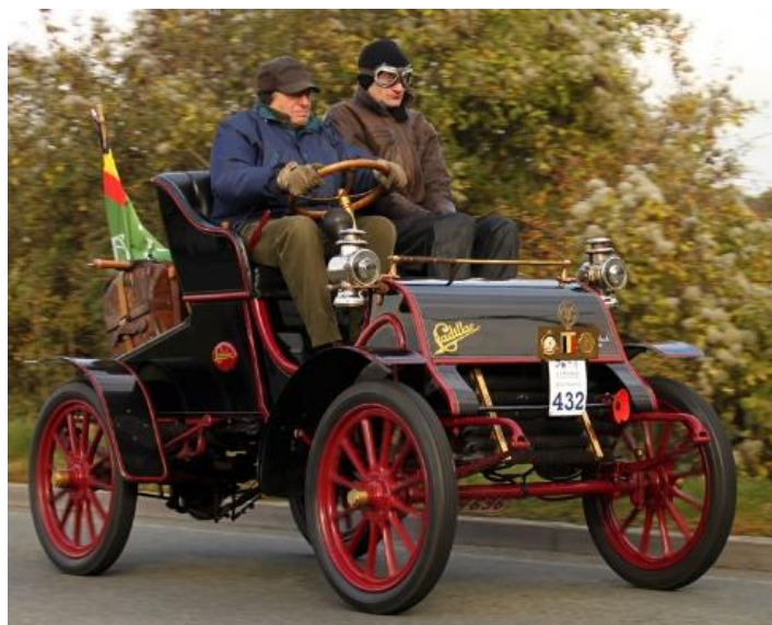
بازسازی یکی از اولین نمونه‌های خودروی کادیلاک

این روز در ضمن با پیمانهای بین‌المللی هم پیوندی دارد. چون در ۱۲۴۳ دوازده کشور معاهده‌ی ژنو را امضا کردند و در ۱۲۵۴ عهدنامه‌ی سن پترزبورگ بین روسیه و ژاپن بسته شد و قرار شد ساخالین و جزایر کوریل بین دو کشور معاوضه شود. هرچند این روابط بین کشورها همیشه هم صلح‌آمیز نبوده است. در ۱۲۲۸ اولین حمله‌ی هوایی تاریخ زمانی انجام شد که اتریش با بالنهایی بی‌سرنشین به شهر ونیز حمله کرد، در ۱۲۸۹ ژاپن کره را به خاک خود منضم کرد و در ۱۳۲۰ ارتش آلمان محاصره‌ی لنینگراد را آغاز کرد.