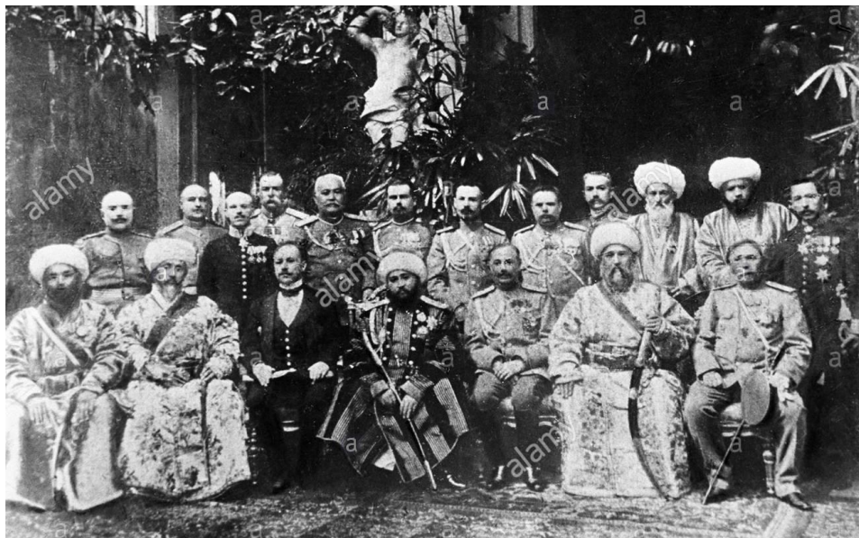
امیر عالم خان حاکم بخارا

آخرین روز مرداد ماه با دست‌اندازی‌های بلشویک‌ها به خاک ایران زمین مصادف بوده است. در این روز به سال ۱۲۹۹ عالم خان امیر بخارا به دنبال حمله‌ی بلشویک‌های محلی که با ارتش سرخ پشتیبانی می‌شدند ناگزیر شد از زادگاهش بگریزد و به افغانستان پناه ببرد. اما خشونت بلشویک‌ها با دهقانان و مردم شهرها چندان بود که داوطلبان جنگ با ایشان گروه‌گروه به وی می‌پیوستند. امیر بخارا نیز اعلام مقاومت کرد و رهبری نیروهای نظامی‌اش را به ابراهیم بیک سپرد که رهبر یکی از قبیله‌های بخارا بود. در همین روز بلشویک‌هایی که رشت را تصرف کرده بودند زیر فشار قوای دولتی که زیر فرمان استاروسلسکی می‌جنگیدند عقب‌نشینی کردند و پشت سر خود خانه‌های شهر رشت را آتش زدند. یک سال بعد در همین روز (۱۳۰۰) سپاهیان دولتی با یک حمله شدید شهر لنگرود را از احسان الله خان که رهبر بلشویک‌ها بود پس گرفت، در این زد و خورد شورشیان یکصد و پنجاه اسیر و دویست کشته و زخمی دادند.