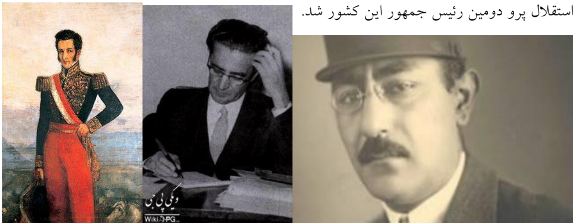
از راست به چپ: اکبر داور، حسینقلی مستعان، خوزه دو لامار

استقلال پرو دومین رئیس جمهور این کشور شد.