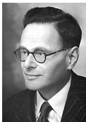
هانس آدولف کربس

درگذشتگان این روز هم عبارتند از پلینی مهتر (۷۹ میلادی)، دیوید هیوم (۱۱۵۵)، جیمز وات مخترع ماشین بخار (۱۱۹۸)، ویلیام هرشل اخترشناس و موسیقی‌دان آلمانی تبار (۱۲۰۱)، مایکل فارادی (۱۲۵۶)، فریدریش نیچه (۱۲۷۹)، نیکولای گومیلیوف ادیب و منتقد روس (۱۳۰۰)، آلفرد کینزی جانورشناس و جامعه‌شناس آمریکایی (۱۳۳۵) و نیل آرمسترانگ فضانورد (۱۳۹۱)