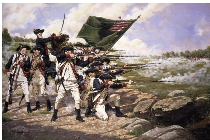
نبرد لانگ آیلند

در پنجم شهریور سال ۱۲۷۵ کوتاهترین نبرد تاریخ جهان بین زنگبار و انگلستان در گرفت. در این نبرد کشتی‌های توپدار انگلیسی قصر سلطان زنگبار -خالد بن برگاش- و پایتختش را به توپ بستند و در نتیجه جنگی که ساعت ۹ صبح آغاز شده بود پس از حدود ۴۰ دقیقه با پیروزی انگلیسی‌ها پایان یافت. در این نبرد ۵۰۰ زنگباری کشته و زخمی شد و از طرف انگلیسی‌ها هم فقط یک ملوان زخم برداشت! این روز در ضمن با نسل‌کشی اقلیتهای قومی هم پیوندی دارد. چون در ۱۳۲۱ نازی‌ها یهودیان شهر سارنی در لهستان را که شمارشان بین چهارده تا هجده هزار تن بود، اعدام کردند، و در ۱۳۶۱ یک دیپلمات نظامی ترک به نام آتیلا آلتیکات در اوتاوای کانادا به انتقام نسل‌کشی ارمنیان به دست یک گروه شبه‌نظامی ارمنی کشته شد.