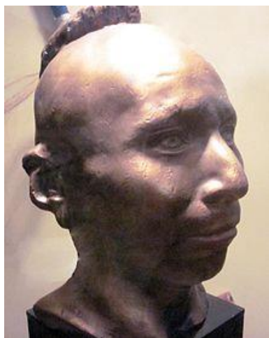
سردیس عقاب سیاه

هزار کشته و زخمی فرانسوی و ۳۸ هزار تن از قوای متحد بود. در ۱۲۱۱ هم عقاب سیاه رهبر سرخپوستان ساوک خود را تسلیم ارتش آمریکا کرد و به این ترتیب جنگهای این قبیله با سپیدپوستان خاتمه یافت.