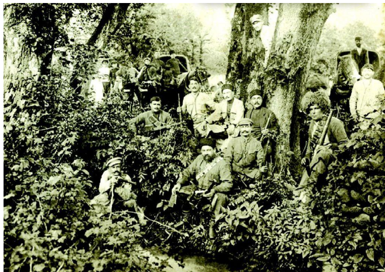
شورشیان گرجی هنگام مقاومت در برابر ارتش سرخ

این روز در ضمن با رخدادهای علمی و فرهنگی چندی هم قرین بوده است. در ۱۱۶۸ ویلیام هرشل یکی از ماه کیوان را کشف کرد و آن را انکلادوس نامید، در ۱۲۲۴ اولین شماره از مجله‌ی Scientific American منتشر شد، در ۱۲۳۸ طی «رخداد کارینگتون» شدیدترین توفان زمین-مغناطیسی ثبت شده باعث