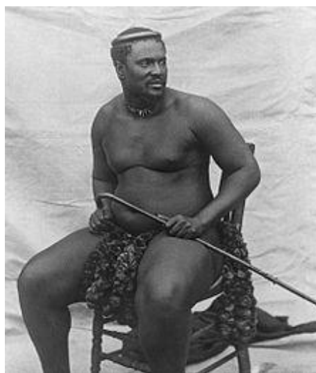
کش وایو آخرین شاه زولوها

در ششم شهریور ۱۲۲۸ و نیز که اعلام استقلال کرده و خود را جمهوری سان مارکو می نامید، پس از یک ماه محاصره تسلیم نیروهای اتریشی شد و این جمهوری از میان رفت، در ۱۲۵۸ کَشش وایو آخرین شاه زولوها به دست انگلیسی ها اسیر شد. در ۱۲۹۵ آلمان به رومانی و ایتالیا به آلمان اعلان جنگ دادند و در ۱۳۰۳ گرجی ها بر ضد حاکمیت شوروی ها سر به شورش برداشتند. در ۱۳۲۳ متفقین شهرهای ماریسی و تولون را گرفتند و در ۱۳۶۹ عراق اعلام کرد کویت استانی از این کشور است و این مقدمه‌ی حمله‌ی نظامی