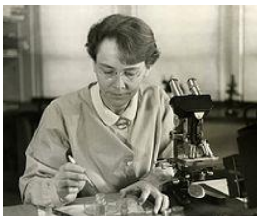
باربارا مک کلینتاک