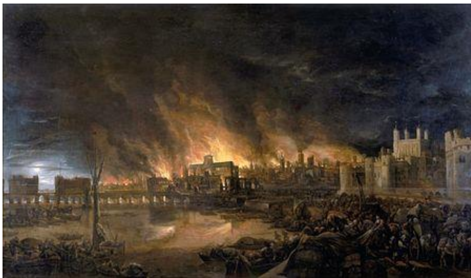
حریق بزرگ لندن

در یازدهم شهریور ۱۱۳۱ انگلستان دو قرن پس از اروپای قاره‌ای تقویم گریگوری را مبنای گاهشماری قرار داد، در ۱۱۶۸ خزانه‌داری ایالات متحده‌ی آمریکا تاسیس شد و در ۱۱۹۰ دانشگاه اسلو گشایش یافت. در ۱۲۸۰ هم تئودور روزولت در سخنرانی‌اش در مینه‌سوتا این جمله‌ی مشهور را گفت که: «نرمخویانه سخن بگویید و چماقی در دست داشته باشید!»