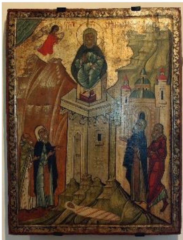
پاپ اینوسان دهم

در یازدهم شهریور ۱۱۳۱ انگلستان دو قرن پس از اروپای قاره‌ای تقویم گریگوری را مبنای گاهشماری قرار داد، در ۱۱۶۸ خزانه‌داری ایالات متحده‌ی آمریکا تاسیس شد و در ۱۱۹۰ دانشگاه اسلو گشایش یافت. در ۱۲۸۰ هم تئودور روزولت در سخنرانی‌اش در مینه‌سوتا این جمله‌ی مشهور را گفت که: «نرمخویانه سخن بگویید و چماقی در دست داشته باشید!»